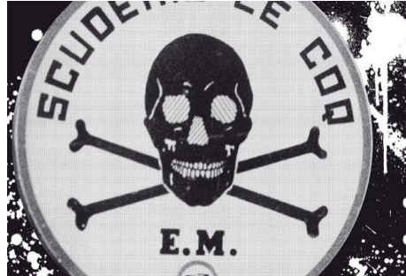
Fig. 4 : Symbole de la « Scuderie Le Cocq » 12

« Escadron de la mort » était également le nom donné au groupe de policiers contrôlés par le commissaire Sérgio Paranhos Fleury lors de la dictature militaire brésilienne. Ce groupe se rendit coupable d'exécutions et de disparitions de centaines de personnes. Ses agissements étaient couverts par un important trafic d'influences sous la protection du régime dictatorial. La pratique de la « chasse aux criminels » de Fleury a été utilisée par les militaires pour combattre les organisations de lutte armée de gauche. A la tête du DOPS (« Département d'ordre politique et social ») – redoutable centre de répression des années de la dictature militaire – Fleury a planifié plusieurs exécutions telles que celle de Carlos Marighela en 1969, celle de Joaquim Câmara Ferreira en 1970, ou encore celle de Carlos Lamarca dans l'État de Bahia en 1971, trois des principaux guérilleros appartenant à la lutte armée de la gauche brésilienne (Souza : 2000).