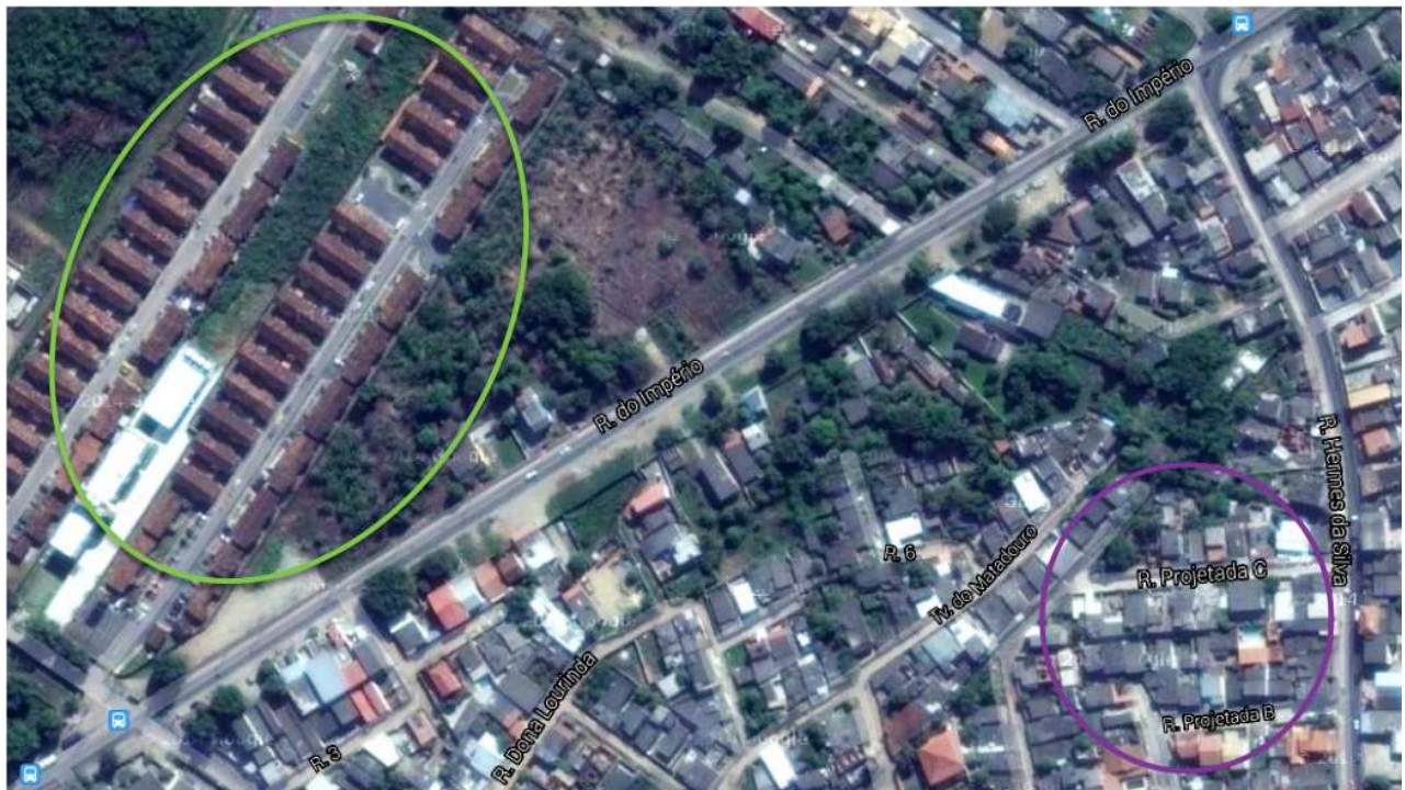
Fig. 1.3 : Image satellite de Santa Cruz, banlieue de Rio de Janeiro (cercle vert : Habitats populaires dans le cadre du projet des logements sociaux « Minha casa, minha vida » (Ma maison, ma Vie) du gouvernement Lula et Dilma (Parti des travailleurs - PT) ; cercle violet : lotissements.