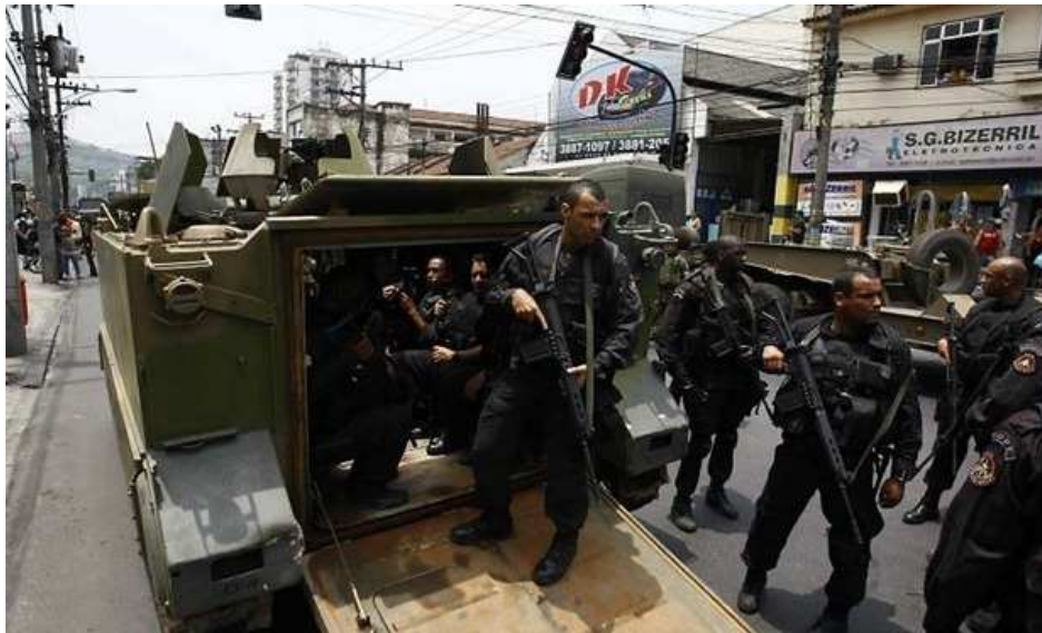
Fig. 5 : Photographie 13 d'une opération du BOPE au « Complexo do Alemão » (zone nord de Rio de Janeiro) dans le cadre de la lutte contre le trafic des drogues

Cependant, cette logique semble fausser car les « miliciens » ont très bien su jouer avec la « sensation d'insécurité » (Míguez, Isla, 2010) des habitants des communautés contrôlées. Laurent Mucchielli utilise le concept de « frénésie sécuritaire » pour développer sa théorie sur un nouveau type de contrôle social. D'après lui, ce concept repose sur un diagnostic qui :