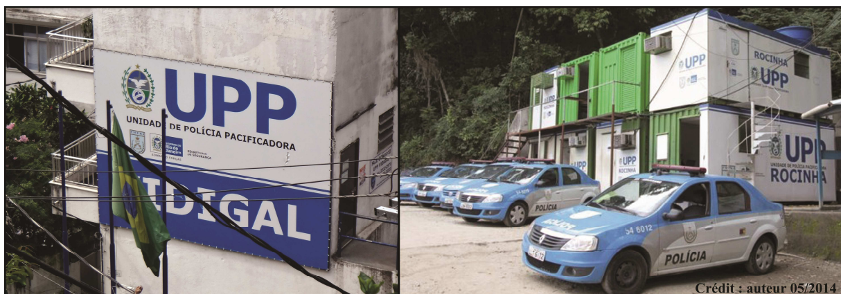
Illustration 1: postes d'UPP à Vidigal et à Rocinha, Justine Ninnin, 2014

En 2008, le Secrétariat de Sécurité Publique de l'État de Rio de Janeiro élabore la politique dite de «pacification», visant à reprendre le contrôle des territoires dominés par des groupes criminels et à améliorer les rapports entre la population et les policiers en mettant en place une occupation permanente par des Unités de Police de Pacification (UPP). Ces opérations mobilisent de jeunes policiers récemment engagés, afin d'éviter les anciennes pratiques de corruption, ils reçoivent une prime mensuelle ainsi qu'une formation spécifique sur les principes de la police communautaire.