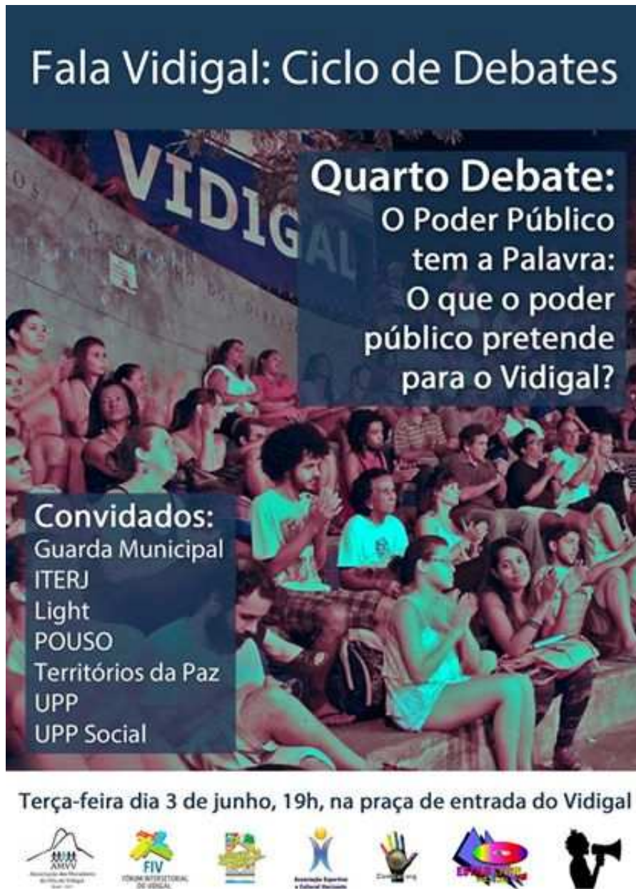
Illustration 4 : Affiche du débat mensuel organisé par l'association des habitants et les organisations locales, présence de représentants des pouvoirs publics (police civile, UPP, urbanistes, programmes sociaux de l'Etat et de la municipalité, compagnie d'électricité) 4