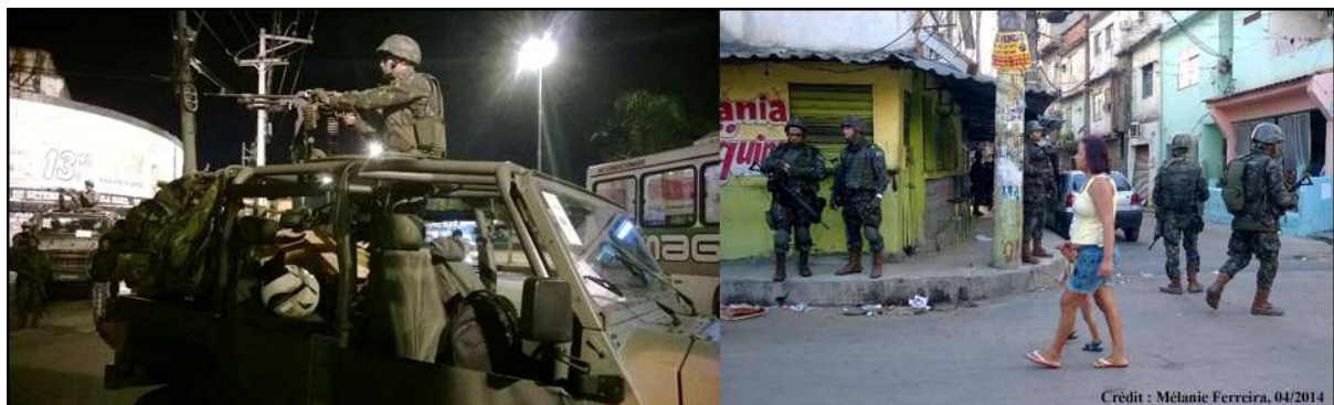
Illustration 2: avril 2014, l'armée venue en renfort lors de la pacification du complexe de favelas de Marê, situé dans la zone nord de Rio de Janeiro.

La présence quotidienne de policiers armés dans les rues des favelas pacifiées contraint les habitants à s'adapter à de nouvelles règles et pratiques sociales qui peuvent susciter au départ une certaine résistance; ce qui avant était résolu par les groupes criminels l'est aujourd'hui par la police. L'élargissement des fonctions dévolues à la police désoriente une partie de la population quant au comportement à adopter face à des policiers à la fois détenteurs de la violence légitime, médiateurs et parfois même éducateurs. Il y aurait un transfert de responsabilités de gouvernance