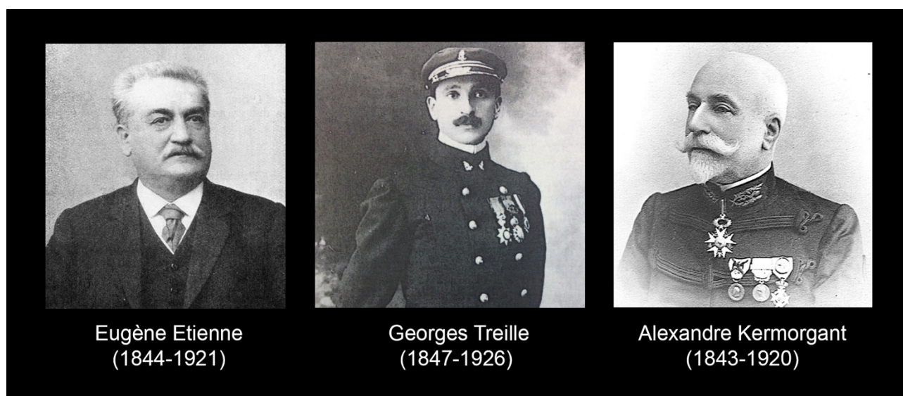
Eugène Etienne (1844-1921)