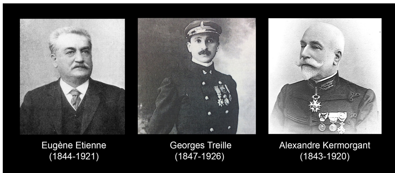
Eugène Etienne (1844-1921)