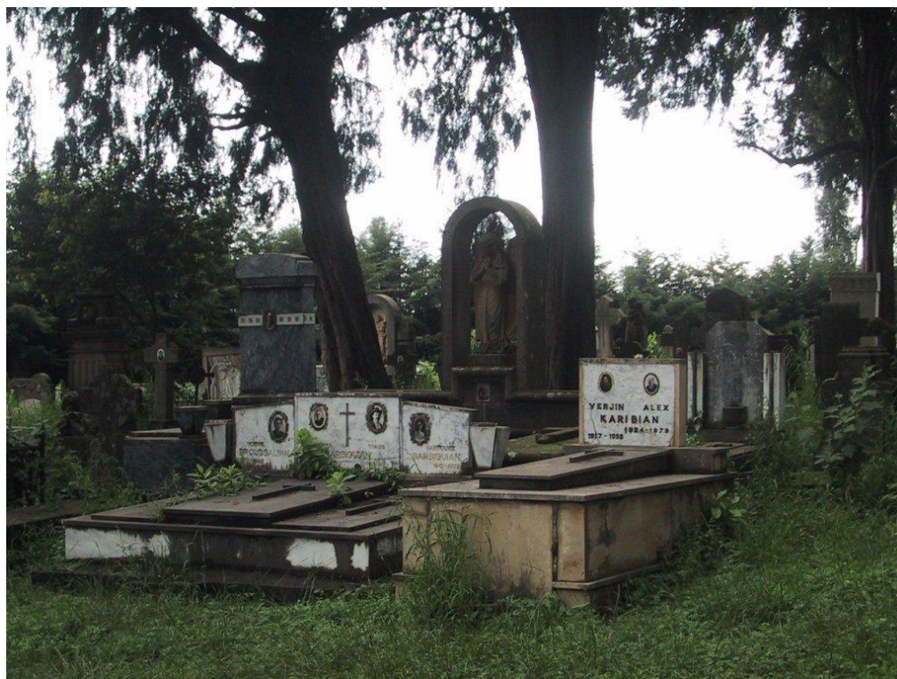
août 2002