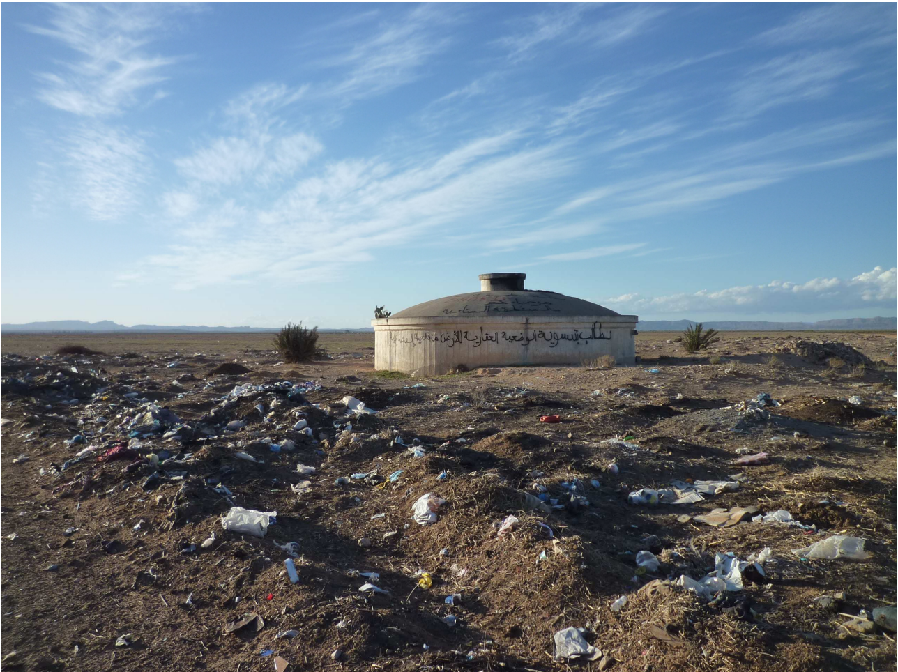
Photo 1 : Ennasr, Maknassy (Fautras, 2013) : Slogans : « Soyez les bienvenus dans la zone industrielle », « On demande la régularisation de la situation des terres et leur réaffectation de l'agriculture vers l'industrie »

Note : La vocation des terres agricoles domaniales qu'on voit à l'arrière-plan n'a pas été modifiée officiellement.