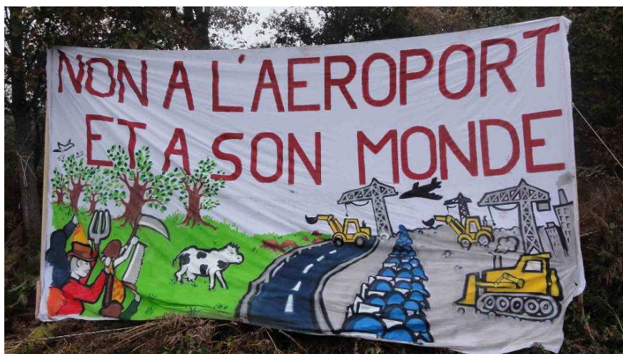
Illustration 5 : Affichage le long d'une route lors de la manifestation de réoccupation le 17 novembre 2012.