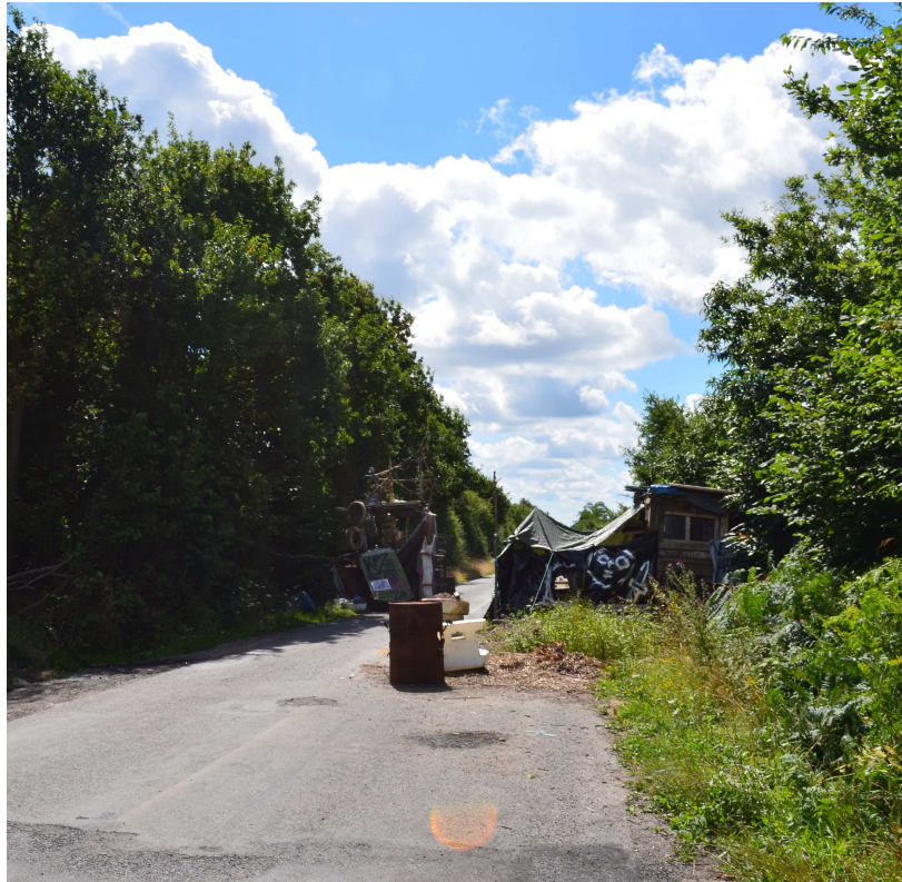
Illustration 2 : Une barricade : entre lieu de vie et lieu de lutte.