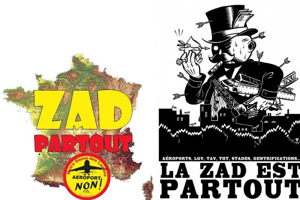
Illustrations 3 et 4 : Exemples d'affiches « ZAD partout ».

Et plus il en arrivait, plus le sigle se vidait de sa signification première. À la place : des constructions, des amitiés, des moments de poésie pure, mais aussi des querelles internes pas toujours surmontées, des voix discordantes, des méfiances rentrées ; et tout cela a contribué – par le fait de rencontres incessantes, de paroles vives, de pratiques communes, de solidarité agissante face à l'ennemi commun – à constituer ce lieu comme Zone à défendre » (Coordination, 2013 : 4).