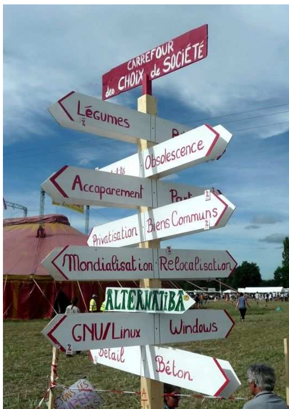
Illustration 6 : Affichage présent sur le site du rassemblement des 3 et 4 août 2013 à Notre-Dame-des-Landes.

La recherche d'autonomie semble aux prises avec une autre difficulté : alors que les « espaces de représentation » des opposantEs à l'AGO se concentrent sur l'espace rural, ses usages et leurs finalités, les « représentations de l'espace » dénoncées sont déterminées par « l'espace dominant, celui des centres de richesse et de pouvoir », en d'autres termes l'espace urbain (Lefebvre, 2000 : 61). L'autonomie dans l'espace rural passerait-elle, dès lors, par un changement de rapport à l'espace urbain ?