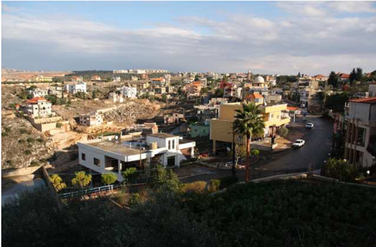
Figure 5 : La zone de al-hamra, où se fait l'extension urbaine (Gharios, 2013)

Plus largement, ce conflit pour le droit au terrain à bâtir révèle une contradiction dialectique. D'un côté, la possibilité de monter une revendication contre le propriétaire du terrain spéculateur, une figure très liée au mouvement confessionnel et quasi-étatique Amal, reflète la prise de pouvoir physique des villageois durant les années de résistance militaire à l'occupation. Mais d'un autre côté, l'environnement légal et étatique plus large au sein duquel Amal à la fois gouverne et représente les villageois du Sud-Liban, demeure peu favorable à la formulation d'un véritable « Droit au Village », voire d'un « Droit à la Ville ». Les villageois, on l'a vu, ont lutté pour les deux éléments qui formeraient un tel Droit : le logement et la maintien de l'activité agricole. Mais les résultats obtenus sont tout sauf le simple récit d'une victoire. Alors que les habitants ont effectivement gagné le droit pour leurs enfants de s'établir au village, le propriétaire conserva le pouvoir de transformer les meilleures terres agricoles en une vaste lotissement rurbain , où de grandes villas rappellent aux villageois pauvres la modestie de leur succès de classe, par rapport à