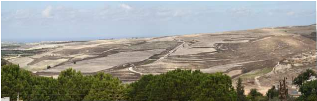
Figure 3 : Vue d'ensemble de la zone agricole de al-duhur , montrant les différentes parcelles agricoles (Gharios, 2013).

Les agriculteurs menèrent une action collective pour protéger leurs droits d'usage. Ils se constituèrent en groupe pour négocier avec le propriétaire : sept paysans, qui mettaient en valeur 121 hectares en agriculture pluviale (soit 78% de la zone x, cf. figure 4). Le propriétaire demeura au Sénégal durant le conflit, mais demanda à son agent ( wakil ) de le représenter dans les négociations. Le maire du village agit comme médiateur. Après plusieurs mois de négociations, un nouvel accord fut trouvé dans lequel les 20% de la production étaient remplacés par un loyer en numéraire. Une délimitation précise des terres fut alors menée pour définir précisément les loyers de chacun. Dans les mois suivant la négociation, un agriculteur au moins décida de ne pas ensemençer sa terre, de peur de perdre de l'argent.