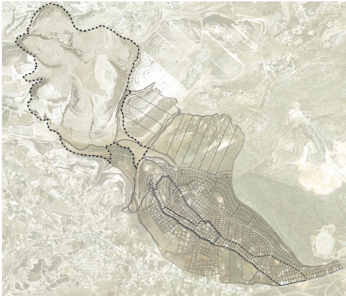
Figure 4 : Carte de Sinay montrant les « zones d'intérêt » où les contestations eurent lieu. Tant la photographie aérienne que la carte cadastrale sont de 2005 et fournies par le Conseil National de Recherche Scientifique libanais.