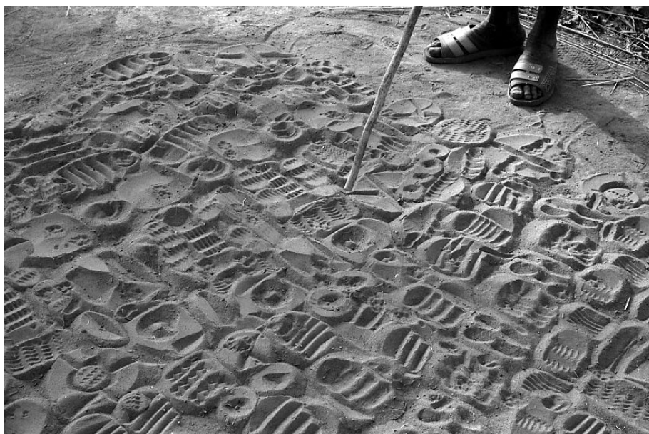
Fig. 7 « Cheminements de la parole », empreintes du renard, table du 12/03/2000

derniers, justement, ne relèvent pas de la parole. Ils sont plutôt de l'ordre du signe : le renard sort de son terrier et crie « quand quelqu'un va mourir », le temps passé à crier informant sur la catégorie d'individu en jeu (enfant, personne âgée) et la direction vers laquelle il se tourne en le faisant indiquant, elle, celle où le décès aura lieu. A travers les formulations, le renard ce faisant montre bien plus qu'il ne dit, alors même que le fait de montrer paraît plus volontiers s'appliquer à ce qu'il fait en laissant ses empreintes sur seulement quelques-uns des signes de la table divinatoire. Ses cris, en effet, ce sont aussi des lamentations, ce sont ses pleurs (cris et pleurs utilisent un même terme, kùrh ) : il est affligé que des enfants meurent, et alors il pleure longtemps (ses pleurs sont moindres pour des personnes âgées, qui auront droit à tous les rites funéraires). Mais laissons cette inversion de côté pour souligner qu'en rendant ainsi sa parole visible, puis « lisible » ensuite par les devins – ils l'énonceront à haute voix : « le renard (ou il) a dit que... » –, le renard nous met en présence d'une parole qui se déploie dans l'espace.