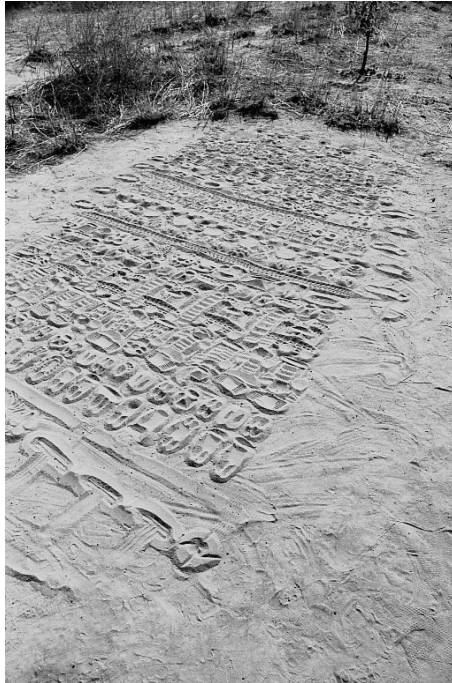
Fig. 1 Table divinatoire du 26/02/2000, cliché ouest-est