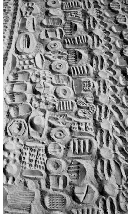
Fig. 2 Table divinatoire du 26/02/2000, détail, cliché sud-nord

La journée va prendre fin. Le devin pose quelques arachides aux extrémités dites « soir » et « matin » de la table divinatoire, orientée Est-Ouest, et de forme rectangulaire (3,5 à 5m x 1,2 à 2m). Puis il part. Les renards, dont les terriers sont là, un peu plus loin à l'ouest, vont venir au soleil couchant. Si tout se passe normalement, l'un d'eux laissera ses empreintes sur les plages de sable (il y a plusieurs emplacements sur le site : plusieurs consultations simultanément). Au matin, première lecture de cette impression du renard, par un devin au moins : suivre la trace de son passage, décrypter « ses paroles ». Pour une même table, deux autres lectures suivront, précédées la veille du dépôt d'arachides à l'ouest puis à l'est – débiter par l'est reviendrait à poser un sortilège au renard : l'envoyer au monde des morts. Il faut donc trois jours pour aboutir une consultation ; trois fois sont nécessaires, dit-on, pour connaître le fond du problème, pour saisir « le problème qui est derrière » dont on ne soupçonne même pas l'existence (il n'est pas encore advenu).