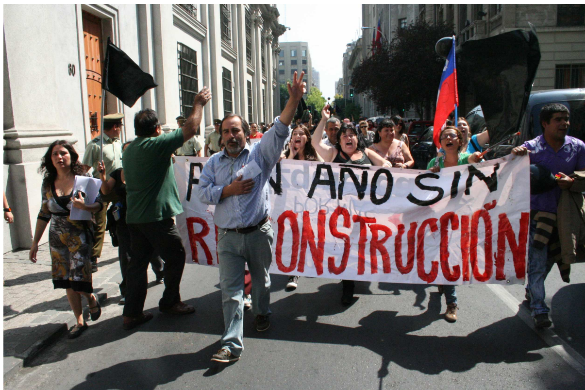
Figure 2. Manifestation du MNRJ et de la FENAPO " 1 année sans reconstruction " à côté du palais présidentiel de La Moneda au Santiago.

En parallèle, les mouvements de victimes du tremblement de terre et tsunami se sont articulés au sein d'un mouvement plus ample nommé Mouvement National pour la Reconstruction Juste (MNRJ). Un des événements importants du mouvement a été la « Première rencontre nationale des sinistrés » qui a eu lieu le 5 octobre 2010 dans le cadre de la Journée Mondiale de l'Habitat organisée à la « Villa Olímpica » de Santiago, un des lieux les plus touchés par le séisme de la Région métropolitaine de Santiago, et auquel ont participé de nombreuses organisations qui travaillaient sur le thème de la reconstruction dans leurs localités.