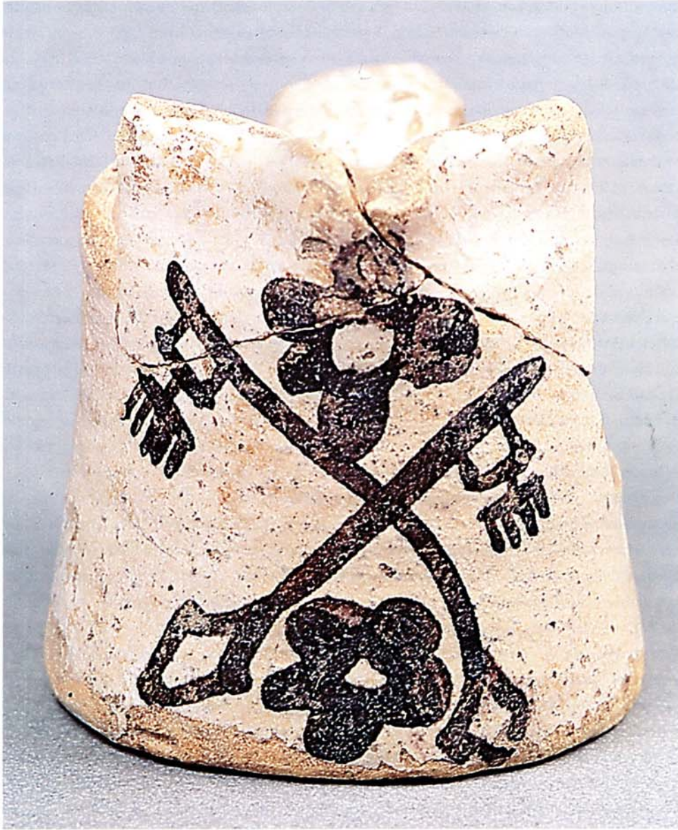
Chope Avignon, l'Oratoire 2 e moitié XIV e s.