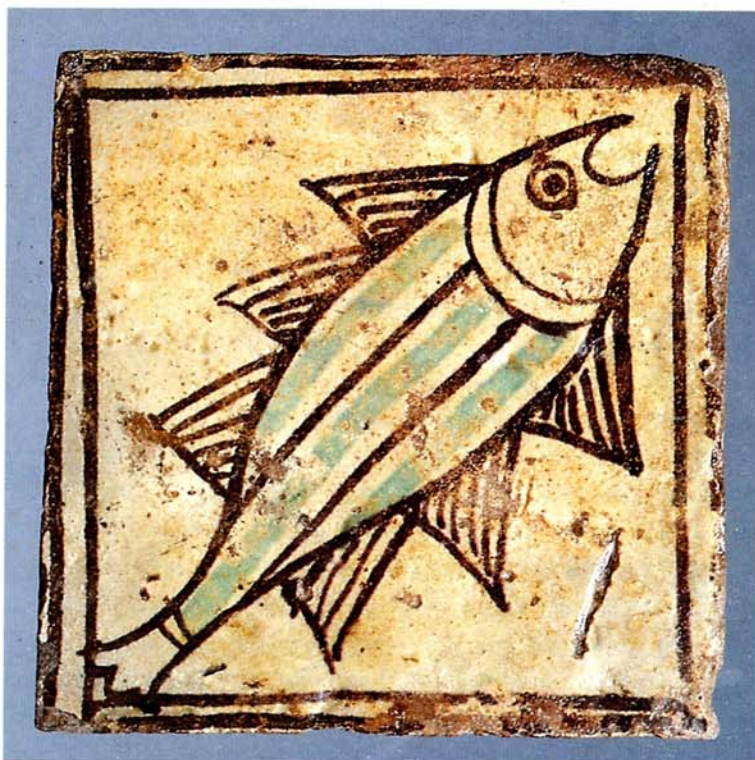
Carreau Châteauneuf-du-Pape, château de Jean XXII 1 er tiers XIV e s.