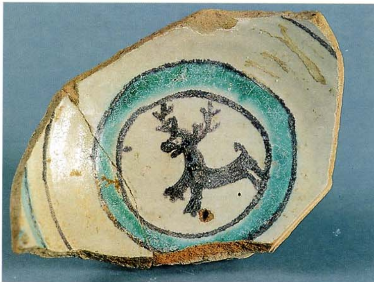
Coupelle Gizean, abbaye Saint-Félix-de-Montceau, 1 re moitié XIV e s. ?