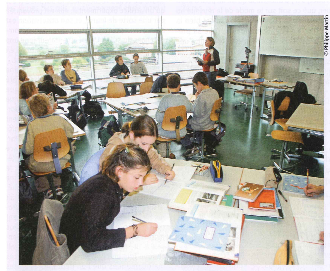
La surprise intrigue, nous questionne et nous défie parfois à la reproduire

2.8 La surprise n'est pas une idée de substitution. Au contraire, il s'agit d'un troisième terme à intercaler entre les pôles de la réussite et de la compréhension. Ces dernières sont attribuables au sujet. Le propre de la surprise est de rompre avec cette manière outrée de tout rapporter au sujet . Pour moi, il va de soi que la surprise ne saurait être confondue avec une prise de conscience ni interprétée comme telle. Le faire serait, une fois de plus, ramener les choses au subjectif. La surprise nous mène ailleurs, comme le dénote l'expression qui dit de quelqu'un qu'il est revenu de sa surprise.