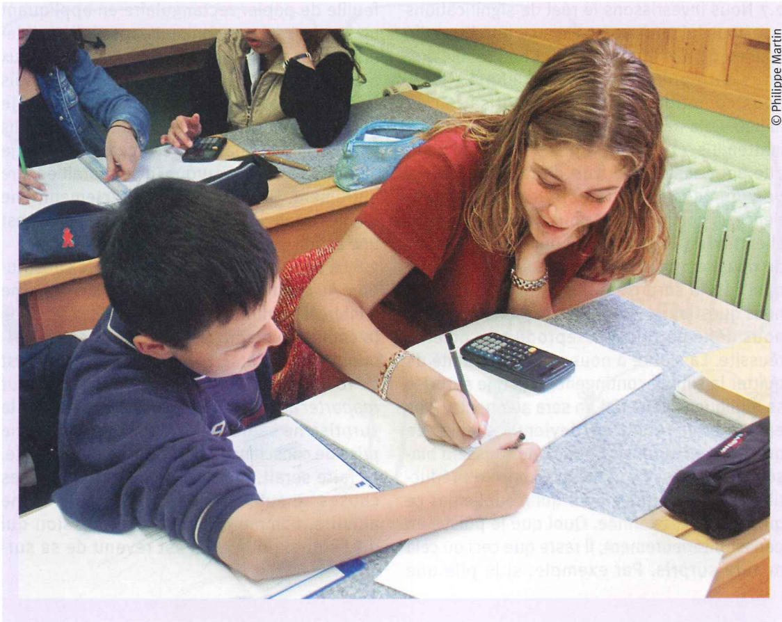
La place centrale que la surprise occupe

En effet, s'il y a une chose qu'on ne peut s'attribuer, que ce soit sur le mode de la réussite ou sur celui de la compréhension, c'est bien la surprise. En elle, le monde exprime sa présence. Ainsi la surprise n'est ni le fruit d'une discipline, ni celui d'une intelligence, mais elle féconde la connaissance. Ch. S. Peirce le souligne fort à propos (ibid): Le phénomène de surprise est en soi éminemment instructif (...): il met en effet l'accent sur un mode de conscience que l'on peut déceler dans toute perception, à savoir la double conscience à la fois d'un ego et d'un non-ego, agissant directement l'un sur l'autre.