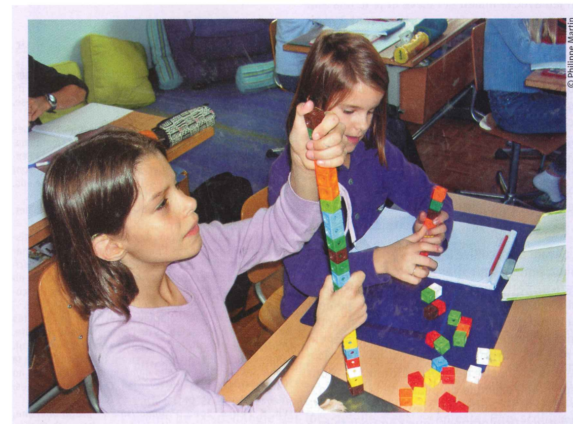
Les surprises que le milieu nous fait sont à la mesure de nos propres connaissances

3.4 Nous voilà rendus bien loin du procédé expérimental de laboratoire, simple révélateur de compétences. Pourtant nous partageons avec ces recherches un postulat: les surprises que le milieu nous fait sont à la mesure de nos propres connaissances. Rapporté aux enseignants, il en découle ceci: pour un enseignant, le succès d'une didactique de la surprise se mesurera à l'aune de sa curiosité et de son intérêt portés conjointement aux mathématiques (ex. les symétries), aux mondes mathématisés (ex. les pliages), aux pensées mathématiques de ses élèves (ex. comment les symétries aident les élèves à penser leurs pliages) et aux relations qui lient toutes ces affaires.