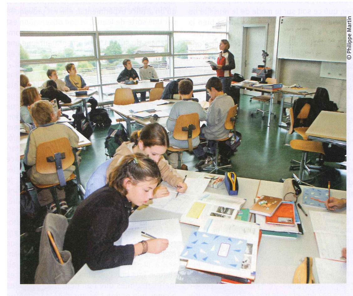
La surprise intrigue, nous questionne et nous défie parfois à la reproduire

2.8 La surprise n'est pas une idée de substitution. Au contraire, il s'agit d'un troisième terme à intercaler entre les pôles de la réussite et de la compréhension. Ces dernières sont attribuables au sujet. Le propre de la surprise est de rompre avec cette manière outrée de tout rapporter au sujet . Pour moi, il va de soi que la surprise ne saurait être confondue avec une prise de conscience ni interprétée comme telle. Le faire serait, une fois de plus, ramener les choses au subjectif. La surprise nous mène ailleurs, comme le dénote l'expression qui dit de quelqu'un qu'il est revenu de sa surprise.