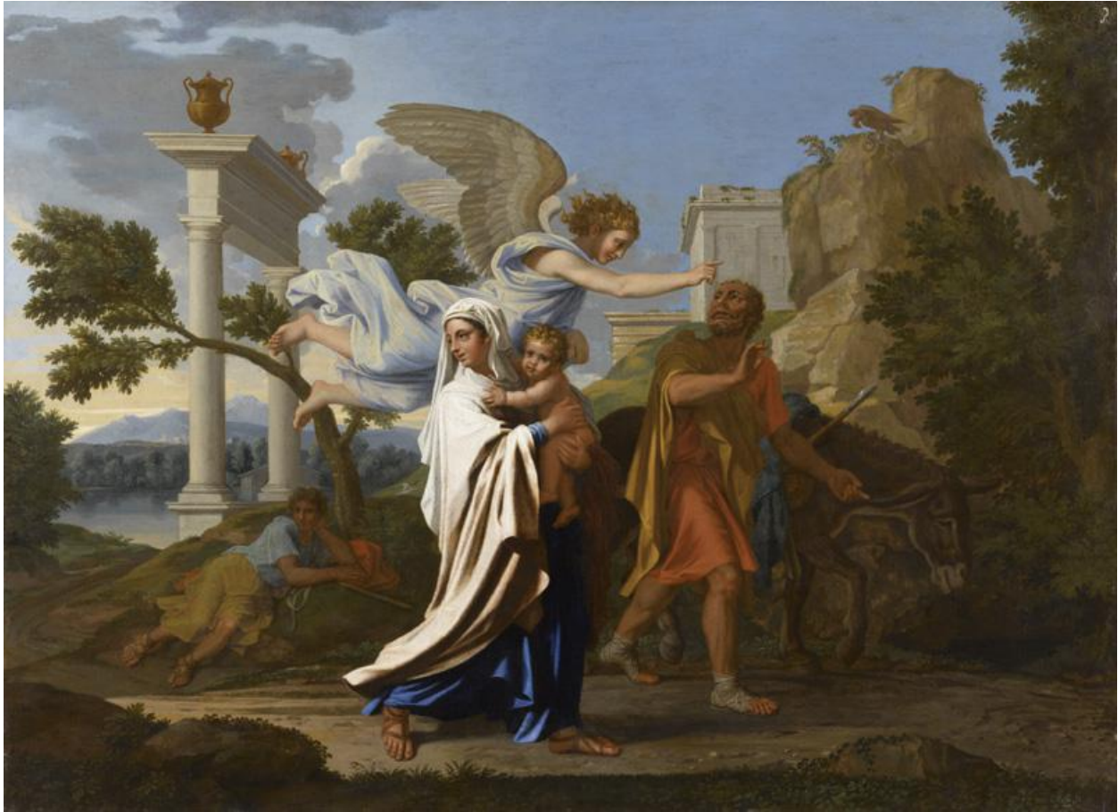
Figure 2 – Nicolas Poussin, La fuite en Égypte , 1657, huile sur toile, 97x133 cm, Musée des beaux-arts de Lyon

que sur cette partie du tableau, la partie droite étant occupée par un rocher. La peinture est typique de la manière tardive de Poussin, pour ses spécialistes, à la fois par le soin apporté à sa composition, et par un certain nombre de détails formels – malade, l’artiste devait alors faire avec un tremblement de ses mains qui peut être aperçu en certains endroits du tableau 47 .