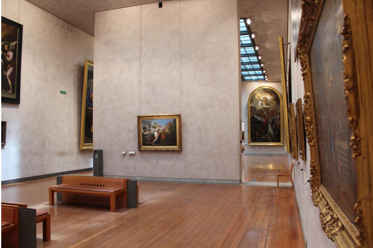
Figure 3 – Vue d’ensemble de l’accrochage de La fuite en Égypte .

Cet ensemble concordant d’indices de l’environnement pointent tous vers l’importance et la valeur du tableau de Poussin 49 . Voilà donc un objet que le musée a jugé bon de singulariser, en l’accrochant à part, en l’entourant d’aides à l’interprétation, et plus généralement en attirant l’attention des visiteurs par un ensemble de dispositifs matériels. La fuite en Égypte corrobore le pouvoir d’attraction du prestige repéré au musée Granet par Jean-Claude Passeron et Emmanuel Pedler. Les observations permettent ainsi de constater que c’est principalement la lecture, dans les dispositifs, du statut de l’œuvre qui provoque un arrêt. Le « duel » qui oppose les toiles de Poussin et de Champaigne pour l’attention des visiteurs est souvent remporté par la seconde, du moins pour ceux qui demeurent le moins longtemps dans la salle, et qui adoptent les stratégies de visite les moins systématiques 50 . C’est que, lorsque le tableau est jugé depuis une certaine distance, sur ses seules propriétés esthétiques, il peine à attirer le regard. A l’inverse, lorsque la