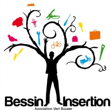
Fig 8, 9/ L'association « Vert Bocage-Bessin Insertion » porteuse du projet de Maison du Vélo de Bayeux

Implantée à proximité des gares SNCF et routière, l'association « Vert Bocage-Bessin Insertion » cherche à offrir des solutions de mobilité depuis 30 ans. L'association qui mettait des véhicules à disposition de ses bénéficiaires (publics en insertion professionnelle, notamment des jeunes et des personnes avec déficiences cognitives légères), a souhaité élargir son offre de mobilité aux vélos. La Maison du vélo est créée dans ce contexte et vient