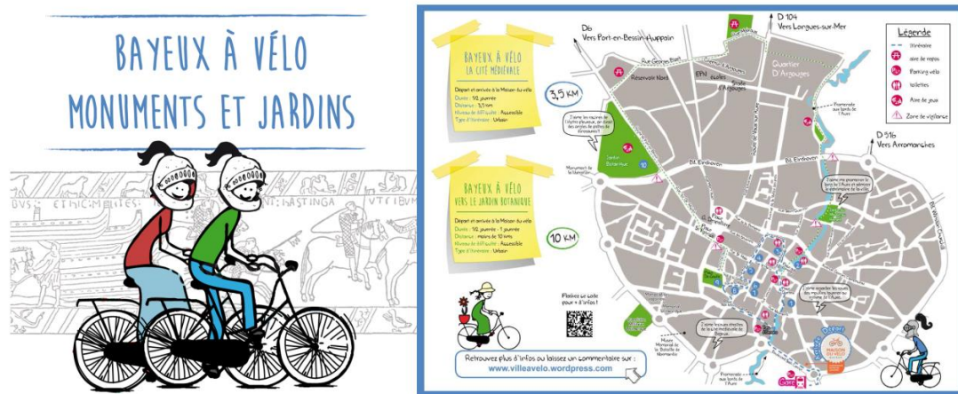
Fig 5 et 6/ Itinéraires à vélo proposés à partir des Maisons du vélo de Bayeux et de Caen par un groupe de 12 stagiaires demandeurs d'emploi dans le cadre d'une formation d'insertion sociale et professionnelle Itinéraire vélo

L'implantation de la Maison du Vélo à proximité de la gare est liée aux opportunités de locaux disponibles et à la volonté forte de la Région. La prise en compte de la gare comme territoire de projet a motivé l'implantation de ce service dans son quartier. La proximité de la gare (100 m à vol d'oiseau) est une alternative à l'implantation de la maison dans le bâtiment-voyageur plus complexe et coûteux.