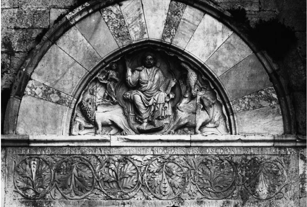
Fig. 12. Villeneuve-les-Maguelonne, antigua catedral. Portada

tras costumbres. Al entrar aquí, reza y llora sin fin tus pecados. Sea cual fuere tu pecado, la fuente de tus lágrimas lo lava” 58 . El texto señala tres veces la entrada del fiel al lugar sagrado ( ad portum, has intrando fores hinc intrans ). La iglesia se describe como el portus vitae y la evocación de la fuente y de la sed remite a la imagen de la puerta. El fuerte valor deféctico de la inscripción, permite anclar su contenido en el tiempo de la enunciación –es la definición de la deixis – y poner en escena el efecto transformador del acceso al edificio eclesiástico. La misma idea leemos en la parte baja del tímpano de la fachada occidental de la iglesia de Saint-Marcelles Sauzet en una inscripción datada a mediados del siglo XIII 59 : “Vosotros que pasáis, que venís a llorar vuestros pecados, pasad por mí, porque yo soy a puerta de la vida; yo soy la puerta de la vida, quiero liberaros; yo os llamo, venid” 60 . La voz que resuena en este texto viene de la imagen de Cristo, en el centro del tímpano. Ella da vida a la puerta e instituye la actualidad de la iglesia como domus Dei . En estos dos textos, la interacción entre la imagen, el texto y el lugar instituye la puerta en tanto que umbral de la sacralidad en la experiencia del fiel 61 . Por