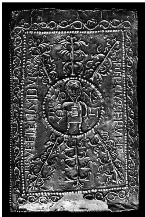
Fig. 8. Girona, Museu d'Art. Altar portátil de Sant Pere de Rodes, cara inferior