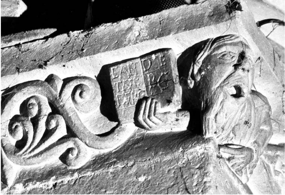
Fig. 15. Saint-Quentin-de-Baron, iglesia. Capitel del cantor

La representación de esos gritos sin ruido, de la presencia de la palabra sin el sonido que la pone en signo, es precisamente el medio de describir en el campo visual lo que pasa en la iglesia. La expresión perfecta de la infinitud de Dios no es sino experiencia interior de silencio y de luz, dos imágenes de la armonía celestial y de su reflejo microcósmico en el corazón del que reza. El silencio se convierte entonces en el signo de algo impronunciable y por ello se puede representar en las imágenes medievales. De esta manera se produce un desajuste semiológico e iconográfico: el silencio se convierte en objeto visual porque pone en signos los límites de lenguaje articulado frente a la infinitud del misterio de Dios 80 .