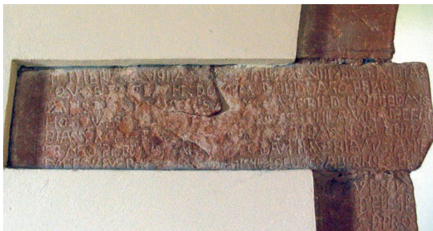
Fig. 7. Fuentes, iglesia San Salvador. Conjunto epigráfico de la fundación