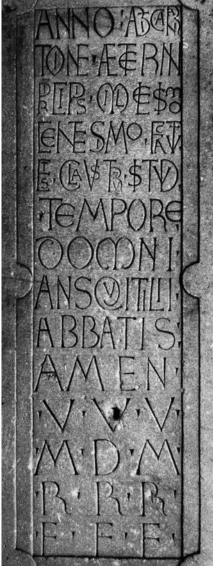
Fig. 5. Moissac, claustro de la abadía. Relato de las obras del claustro (c. 1100)