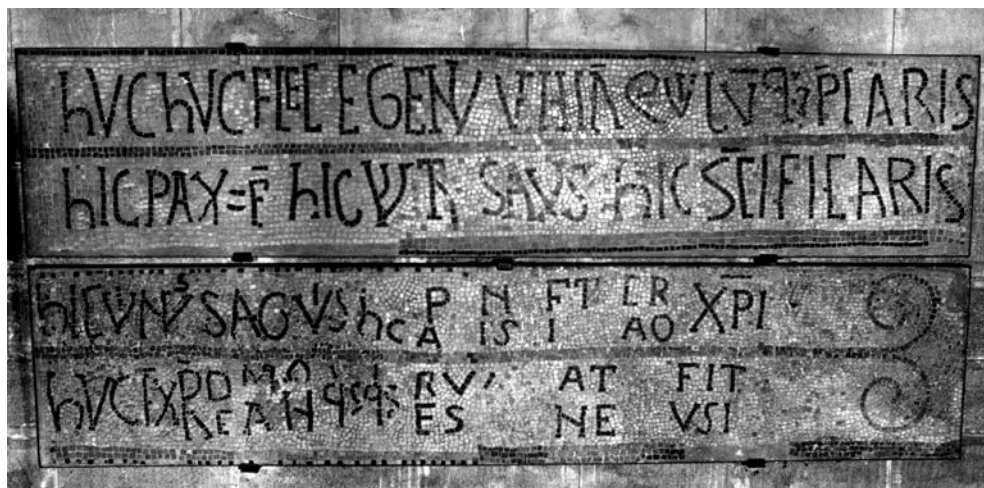
Fig. 10. Lyon, Saint-Martin-d'Ainay. Mosaico del altar mayor

la redención y la santificación se manifiesta hic et nunc en la inscripción y el sacramento se instituye en un presente continuo asegurado por el monumento epigráfico y su instalación en el corazón de la iglesia 39 .