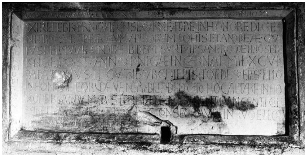
Fig. 2. Poitiers, iglesia Saint-Jean-de-Montierneuf. Relato de la consagración del altar de maitines (1096)

En 1096, el papa Urbano II, de paso por Poitiers, consagra la iglesia y el altar de maitines de San Juan de Montierneuf 4 . El recuerdo de esta ceremonia singular, polémica por más de un motivo 5 , se conserva en el documento epigráfico realizado en el momento de la ceremonia (Fig. 2). Situado en el santuario de la iglesia abacial, en contacto con el altar mayor, igualmente mencionado en el texto, la inscripción propone un ordenamiento de la historia de Montierneuf