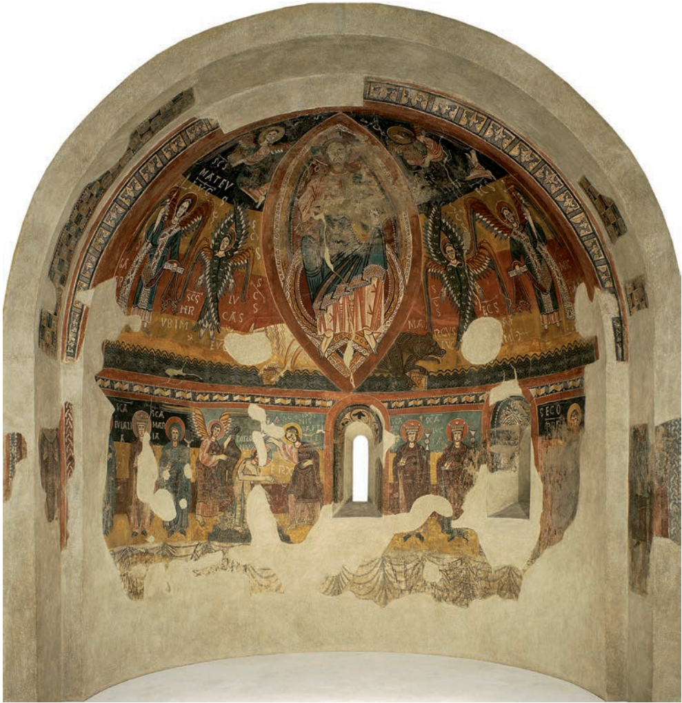
Fig. 14. Estaon, iglesia Santa Eulàlia (Museu Nacional d'Art de Catalunya, Barcelona). Pinturas murales del ábside

inscrita en el libro abierto es difícil de establecer. Sea como fuere, la imagen de Saint-Quentin-de-Baron contiene la acción de un sonido y la obligación de cantar, podría incluso contener las propiedades armónicas de la voz, pero no por ello es menos silenciosa. La escultura no produce sonido más que en imagen y coloca más que nunca a la piedra, y a aquel que la contempla, frente al silencio de la iglesia.