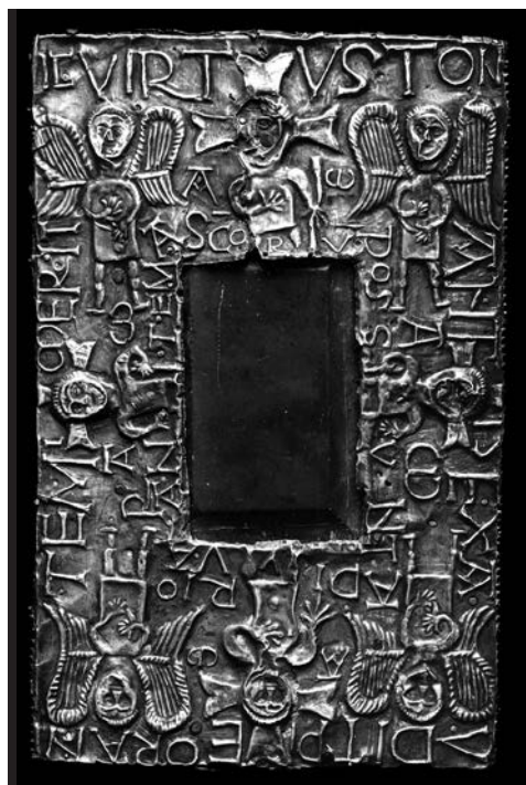
Fig. 9. Girona, Museu d'Art. Altar portátil de Sant Pere de Rodes, cara superior

la iglesia en el siglo XI, y un breve texto recuerda la dedicatoria del templo por el papa Pascual II (Fig. 10): HANC AEDEM SACRAM PASCHALIS PAPA DICAVIT. A continuación de la inscripción, cuatro versos traducen materialmente el efecto que la consagración tiene sobre el fiel que entra en la iglesia: “En este lugar, aquí mismo, inclina la rodilla, tú, el desconocido que implora el perdón. Aquí está la paz, aquí está la vida, aquí está la salvación, estás santificado. Aquí el vino se transforma en sangre y el pan en cuerpo de Cristo. En este lugar, abre las manos, seas quien seas, tú, antaño pecador 38 ”. Los cuatro versos empiezan por un deíctico que inscribe la experiencia de oración y de redención en el lugar consagrado por el papa Pascual; la anáfora de hic y de huc , responde así al hanc aedem del primer verso, y la expresión en pasado ante fuisti , remite al dicavit del primer texto. El conjunto de la inscripción construye de esta manera una especie de oposición entre un pasado negativo anterior a la manifestación de la sacralidad y a los beneficios de una actualidad sagrada encarnada en el edificio en el que el fiel está ya rezando ( precaris ). Los versos 2 y 3 instituyen el ritual eucarístico en una permanente exposición en el altar situado delante del texto: la transformación de las especies que permiten