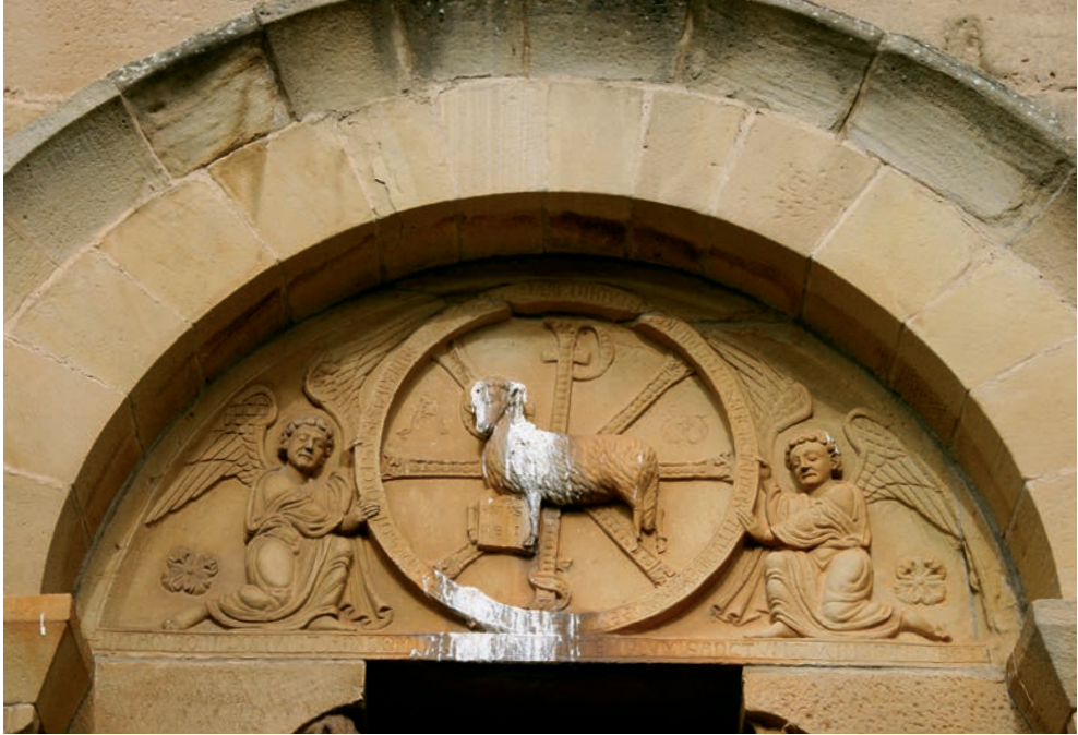
Fig. 13. Aguilar de Codés, ermita de San Bartolomé. Portada sur

la liturgia en tanto que proclamación de la palabra divina. En el texto inscrito en el libro que sujeta el evangelista Marcos, abajo a la izquierda de la mandorla, se lee un fragmento de Mc 16, 14: Novissime recumbentibus illis Undecim apparuit, et exprobravit incredulitatem illorum et duritiam cordis, quia his qui viderant eum resurrexisse, non crediderant ; sólo se han inscrito las palabras recumbentibus y undecim , que no corresponden al pasaje de la Vulgata, sino a la formulación del evangelio tal y como se lee durante la solemnidad de la Ascensión. La lectura precisa la inscripción del libro de Marcos podría explicar, o al menos en parte, la forma peculiar de la mandorla, por el hecho de que se trata tanto de una maiestas Domini como de una imagen de la Ascensión. La composición de Fulvià trataría de convertir en presente la huella del efecto de la celebración litúrgica, no en su dimensión conmemorativa, sino en su dimensión activa e inmediata. Las imágenes y los textos de Fulvià son el instante de la Ascensión tal y como se manifiesta en la experiencia del fiel del lugar sagrado.