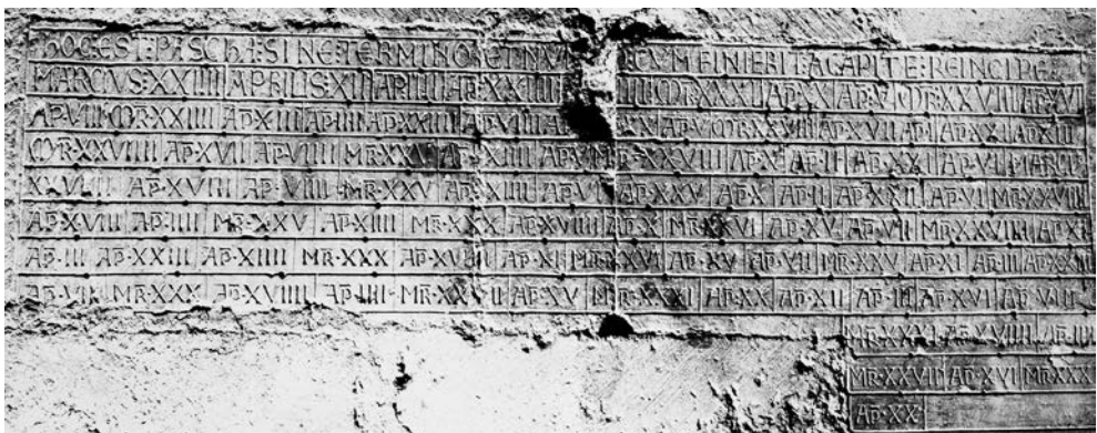
Fig. 1. Périgueux, iglesia Saint-Etienne-de-la-Cité. Tabla de Pascua (mediados del siglo XI)

A mediados del siglo XI, los clérigos de Saint-Étienne de la Cité de Périgueux mandan colocar en el altar mayor de la iglesia, en el coro, una gran losa de piedra en la que estaban inscritas las fechas de celebración de la fiesta de Pascua (Fig. 1) 1 . En el momento de su realización, permanecía invisible para los fieles de Saint-Étienne y sin duda era ilegible para la mayor parte de los celebrantes que frecuentaban el coro de la iglesia. Fijada en la estructura del santuario, muy cerca del altar, el ciclo pascual de Périgueux no tiene función litúrgica real y debe entenderse como la “huella” del tiempo litúrgico en acción en el interior del edificio 2 . De hecho, las indicaciones contenidas en el texto no permiten emplear la tabla pascual como una auténtica tabla. La inscripción propone una lista de fechas introducida por la designación del contenido y de su modo de empleo: “Cuando se llegue al final (de la lista), que se vuelva