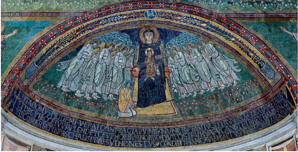
Fig. 11. Roma, Santa María in Domnica. Mosaico del ábside central

La inscripción no se refiere directamente a la imagen del mosaico, sino al edificio y a lo que contiene de la virtus de los santos y mártires presentes en el templo a través de sus reliquias 49 . El oro responde a esta potencia imperceptible y la convierte en visible. Tales consideraciones son frecuentes en las inscripciones situadas sobre los altares, incluso cuando se trata de altares de piedra, sin ningún adorno metálico, como por ejemplo uno de los altares de Saint-Savin-sur-Gartempe, datado en 1050 y cuya inscripción empieza por la expresión Iste locus fulget 50 .