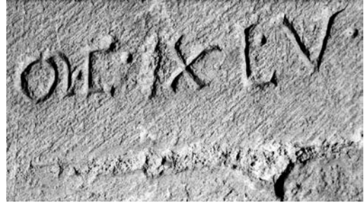
Fig. 6. Le Mans, catedral. Fecha inscrita en un pilar del santuario

iglesias bretonas trazadas sobre elementos de la estructura que solamente dan una fecha para las modificaciones arquitectónicas 28 . Sobre uno de los pilares de la catedral de Le Mans, sólo se ha inscrito una fecha para marcar el fin de las obras del santuario (Fig. 6) 29 . Nada permite plantear, en estos pocos ejemplos, un uso conmemorativo de la inscripción, sea cual sea la extensión de ésta; no desencadena una respuesta litúrgica o ceremonial; marca el edificio, en sentido propio, en su cambio de estado.