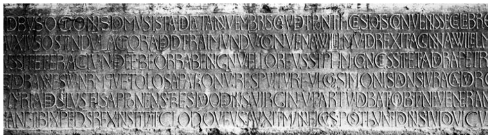
Fig. 3. Moissac, iglesia de la abadía. Inscripción de consagración de la iglesia (1063)