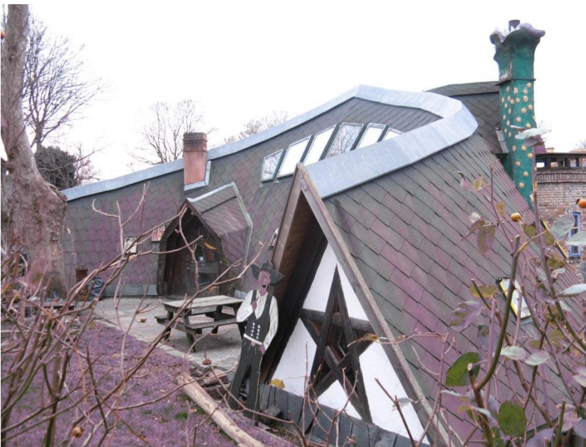
Figure 2 : L'arrière de la Bananhuset

De même, les résidents de la Nouvelle Atlantide de Bacon vivent dans des maisons en brique avec des vitres aux fenêtres. Ces deux auteurs assimilent l'entrée de la lumière dans les logements au progrès. Alors que More imagine un plâtre qui a à peu près les qualités du ciment Portland ordinaire (OPC) 26 , bien que fondamentalement différent en ce qu'il ne coûte rien, les 'Chambres de santé' de Bacon pourraient être vues comme préfigurant les préoccupations actuelles en matière de qualité de l'air intérieur (QAI), notamment la conception de projets de l'architecture durable contemporaine à l'épreuve des courants d'air, comme les maisons passives. A l'inverse, le patriarche protagoniste de L'Île des Pins assemble rapidement une cabane de poteaux de bois brut, plaquée de planches récupérées de son naufrage et couverte de toile à voile, avant de passer aux choses sérieuses : la création de ce que Susan Bruce qualifie de 'pornotopie' 2 - un lieu « où les bancs moussus des rivières et les arbres fournissent tous les abris nécessaires » (Bruce, 2008, p XXXIX).