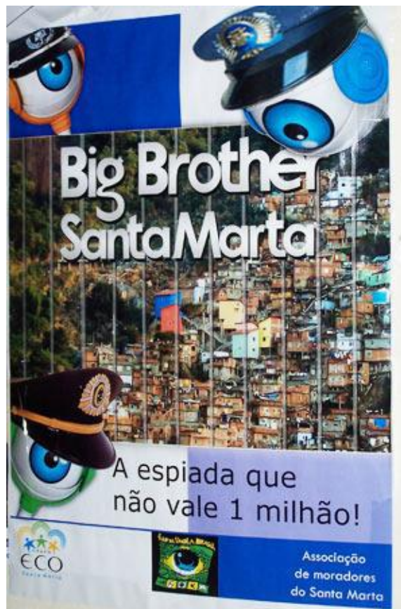
Doc. 2. Affiche élaborée par l'association des habitants du quartier de Santa Marta critiquant la mise en place d'un système de vidéosurveillance des rues de la favela 16

Dans un tout autre contexte spatial, en périphérie ouest de la ville, le quartier Cidade de Deus (Cité de Dieu), composé de plusieurs favelas et d'importantes zones d'habitat collectif, a été le deuxième lieu d'installation d'une UPP (2009). C'est avant tout la proximité directe de la Cité Olympique en cours de construction et la forte résonance médiatique des lieux qui expliquent qu'elle occupe une place prioritaire dans ce dispositif de pacification : Cidade de Deus a, en effet, été rendu internationalement célèbre par la violence criminelle qu'elle abrite, très largement médiatisée depuis le tournage du film éponyme de Fernando Meirelles sorti en 2002. Sa taille a néanmoins rendu le processus d'expulsion des narcotrafiquants armés plus long – et plus violent que pour Santa Marta.