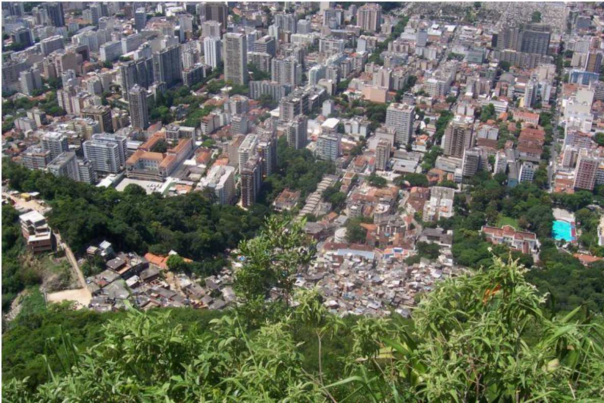
Doc.1. Au premier plan, la favela Dona Marta, au bas de laquelle s'étend le quartier de Botafogo

Cette situation a notamment suscité une forte mobilisation des habitants contre cette décision (Doc.2) . Etant donné sa centralité et le caractère pionnier des initiatives de sécurisation, cette favela est devenue le laboratoire et la vitrine de la politique de sécurité publique de la police militaire de Rio de Janeiro, traduite par l'installation permanente, à partir de décembre 2008, de forces de police pacificatrice.