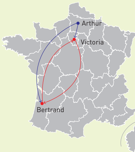
Figure 1 Schématisation d'une demande de mutation

Pour donner une illustration simple focalisons-nous sur une situation où uniquement trois enseignants participent au mouvement interacadémique. Prenons donc Arthur, Bertrand et Victoria qui sont respectivement initialement affectés à Amiens, Bordeaux et Versailles. Victoria et Bertrand ne font qu'une seule demande de mutation pour respectivement l'académie de Bordeaux et de Versailles. De son côté, Arthur fait deux demandes de mutations, une à Versailles et l'autre à Bordeaux. Les demandes de mutations sont synthétisées par la figure 1 .