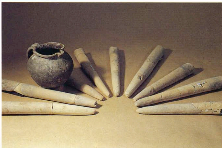
3. Barres de terres destinées à supporter les pots.