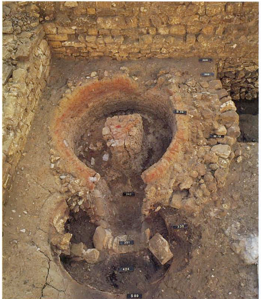
2. Four à pilier central reconstruit sur un ancien four.