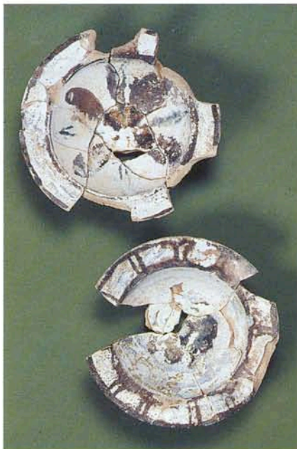
1. Coupelles en faïence verte et brune.

Les vases destinés à la cuisson des aliments n'ont été retrouvés que dans les niveaux les plus anciens de l'atelier. Cette production est abandonnée pour des raisons encore inexplicables, peut-être à cause d'une inadéquation de la composition de la pâte ou de la concurrence d'un autre atelier de céramique culinaire ? L'étude conduite par Marie Leenhardt permet dès à présent d'avoir une première image des formes produites : pots à une anse ( pégau ), couvercles ainsi que des marmites globulaires et jattes aux formes jusqu'alors inconnues en Provence. Certains fonds percés ne sont pas sans rappeler les couscoussiers.