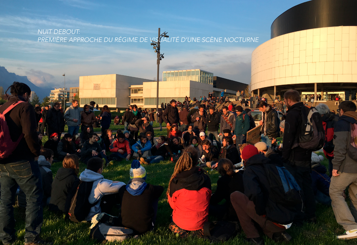
Fig. 9. Cercles de parole, Grenoble