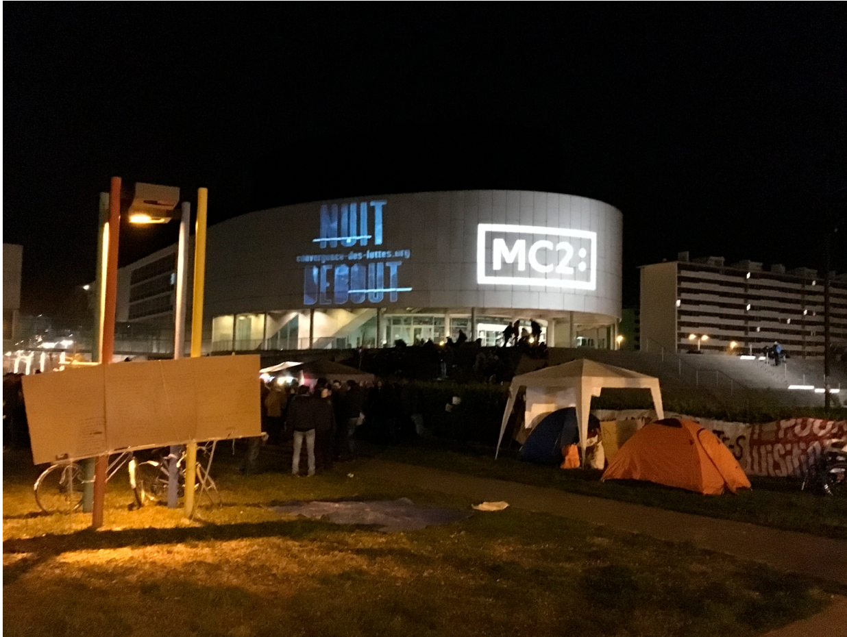
Fig. 10. Projections à Nuit debout Grenoble