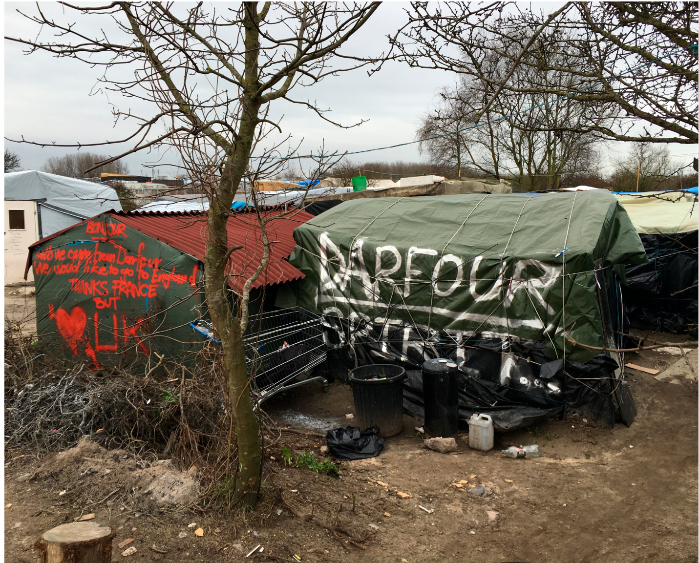
Fig. 12. Habitat de fortune dans la « jungle » de Calais

Les installations de Nuit Debout sont du côté du souple, du mobile et du temporaire face aux aménagements et infrastructures plus pérennes de la ville contemporaine ou aux bunkers de la culture institutionnelle. Les occupants sont du côté du transversal, alors que le pyramidal et le hiérarchique restent de mise. Ils détournent et rusent là face à des institutions « à bout de souffle » (Frérot) qui craignent l'innovation. Par leurs appropriations, ils fabriquent une ville métaphorique qui résiste à la ville dominante (Gwiazdzinski 2016, « La ville à l'épreuve des places. »). Au moment où des expositions nous interpellent sur la possibilité d'« habiter le campement » (Collectif 2016), alors que l'État peine à trouver des solutions adaptées pour l'accueil des migrants notamment à Calais (Figure 12), les occupations de Nuit Debout obligent à s'interroger sur les modes d'habiter, les pratiques, mais aussi les mots, les images, les sons, les représentations et les inconscients de toutes sortes qui les accompagnent (Lazzarotti).