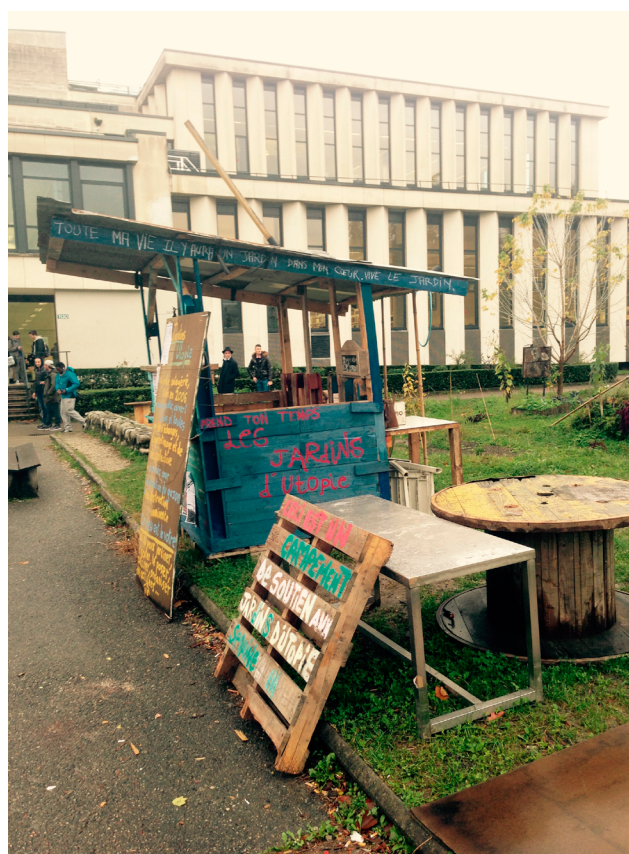
Fig. 8. Jardin d'utopie sur le campus universitaire de Grenoble Sources : photographies de l'auteur, 2016

À une autre échelle encore, on a vu se développer les actes de « guérilla jardinière/potagère », ces formes d'occupations portées par la « génération végétale » (Bastien et al.) comme à Grenoble avec les jardins d'utopie (Figure 8) sur le campus universitaire ou à Strasbourg où des collectifs ont installé, jardins, poulaillers et baraquements sur des espaces appartenant aux pouvoirs publics.