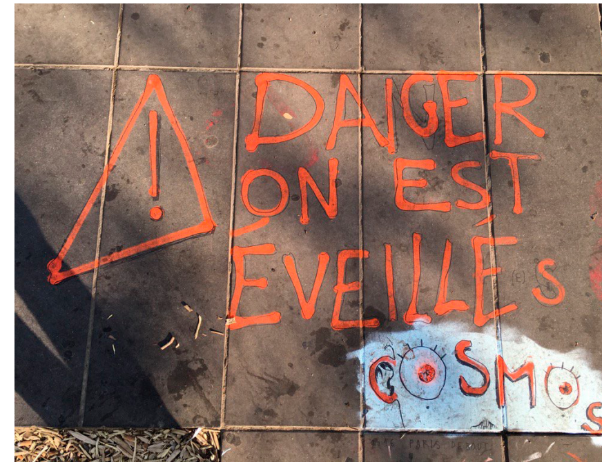
Fig. 1. Inscription au sol, Nuit debout Paris

Avec le mouvement des places, une autre nuit s'invite dans l'actualité du jour. Loin de la colonisation par la lumière et le marché, loin du repli sécuritaire et du marketing événementiel des « nuits blanches », le mouvement permet de redécouvrir les dimensions politiques et humaines essentielles de la nuit. L'histoire montre que quand les opinions politiques font l'objet de poursuites, il reste la nuit pour les exprimer secrètement. Alors la nuit n'est plus licence, elle devient liberté. C'est là que les conjurés se cachent, que les jacqueries se fomentent, que Spartacus lève ses troupes, que la résistance imprime ses journaux, que la Movida résiste au franquisme et que chacun refait le monde. C'est là que Nuit Debout a choisi de s'installer reprenant à son compte toute la charge symbolique et toutes les ambiguïtés de la nuit (Figure 1).