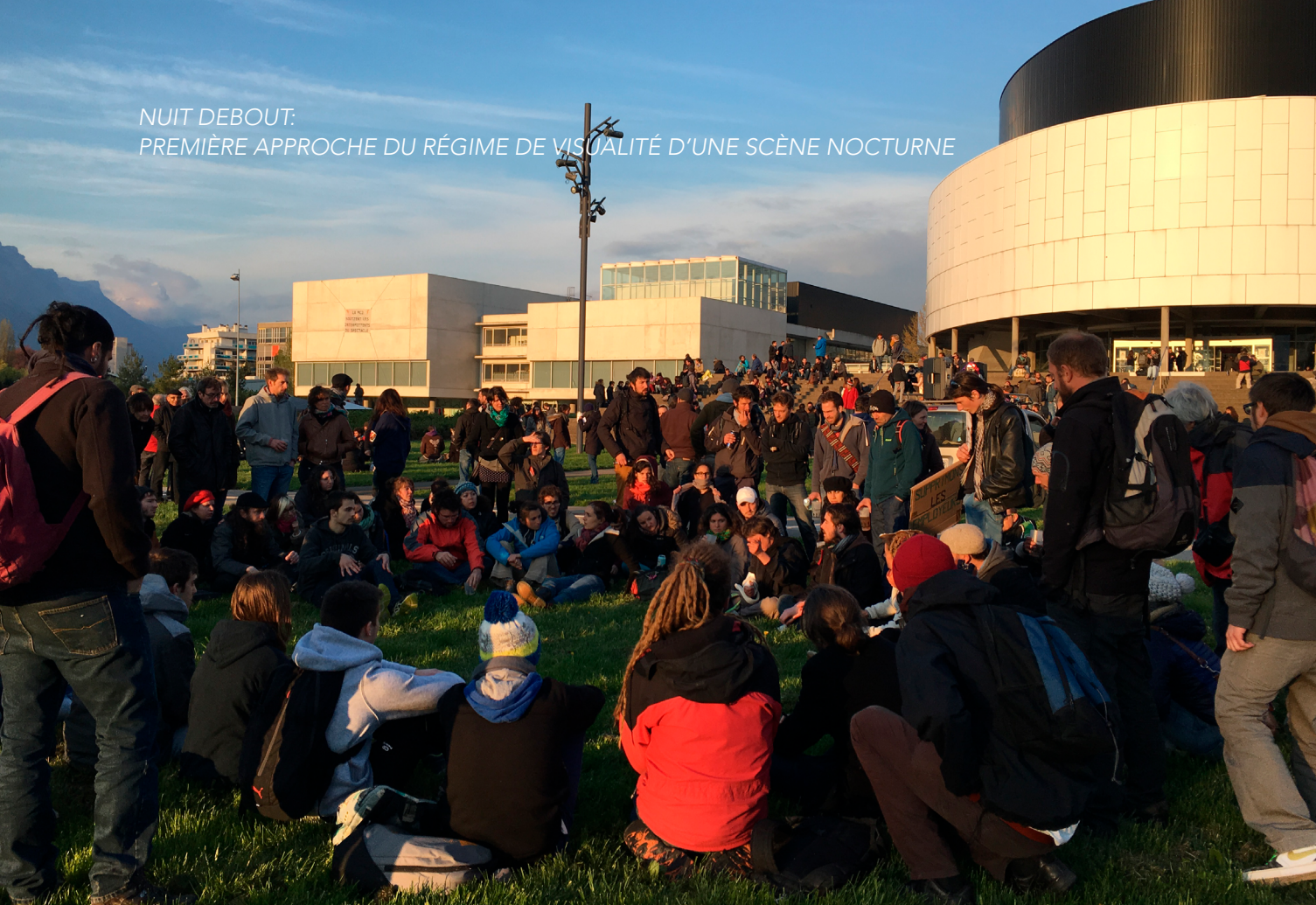
Fig. 9. Cercles de parole, Grenoble