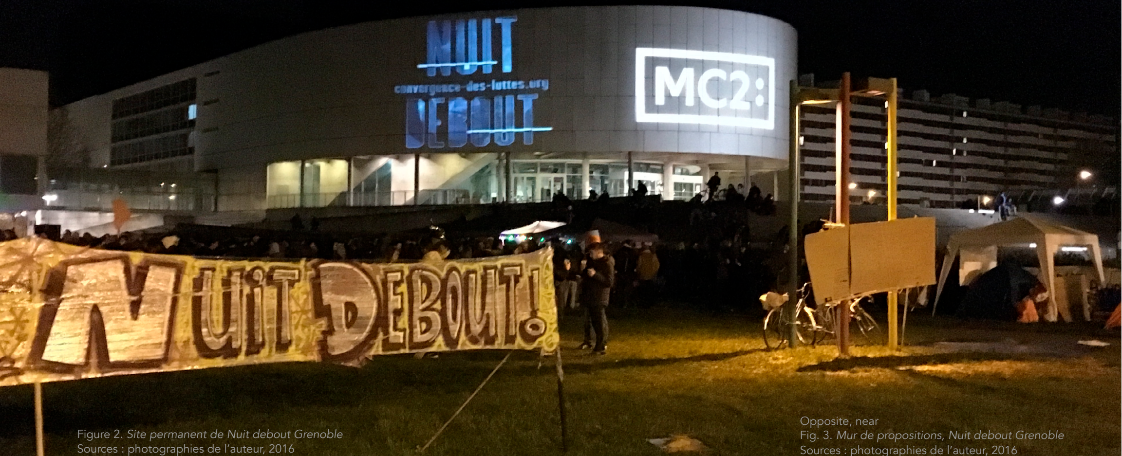
Figure 2. Site permanent de Nuit debout Grenoble