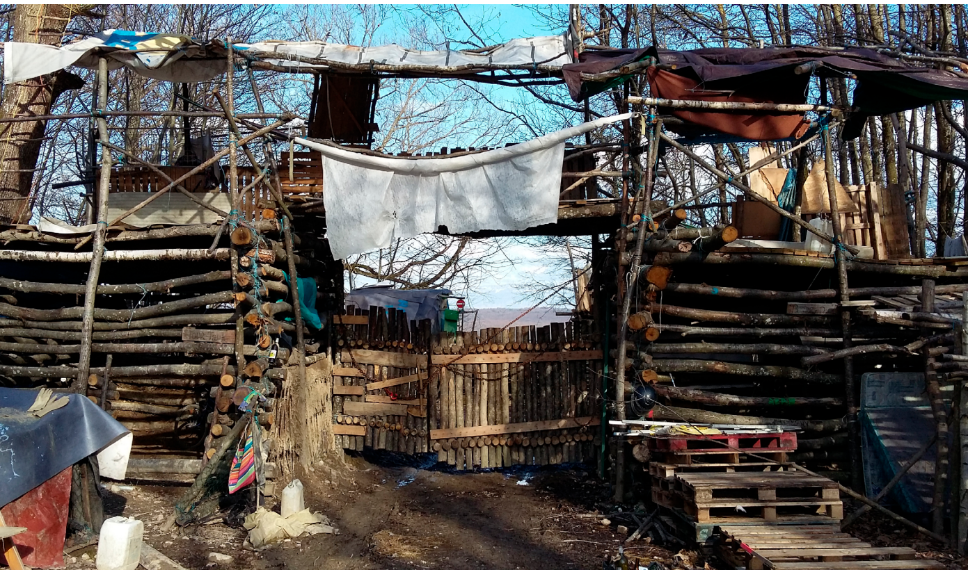
Fig. 7. Barricades sur la ZAD de Roybon