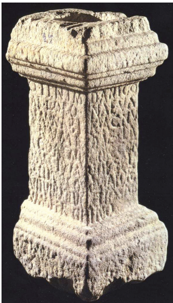
Fig. 3a : Cliché IPM/Musée de Penafiel