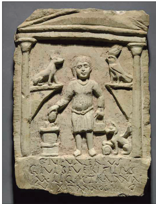
Fig. 2 : La stèle de C. Iulius Valerius. New York, Musée de Brooklyn (= Greek and Latin Inscriptions in the Brooklyn Museum , New York, 1972, Pl. XIV)