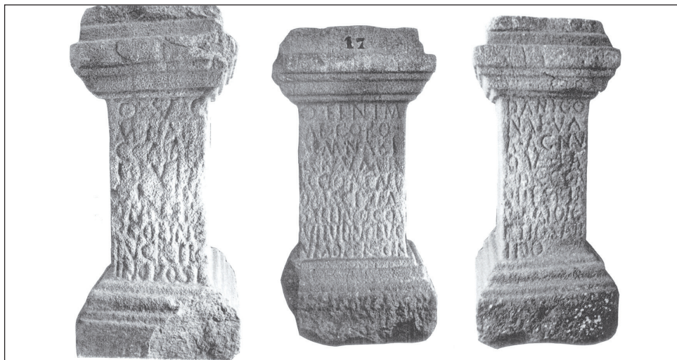
Fig. 3b : Cliché P. Le Roux