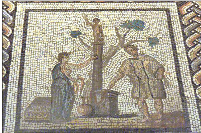
Fig. 1 : Scène de culte (Saint-Romain-en-Gal). Saint-Germain-en-Laye Musée des Antiquités Nationales, tableau XV