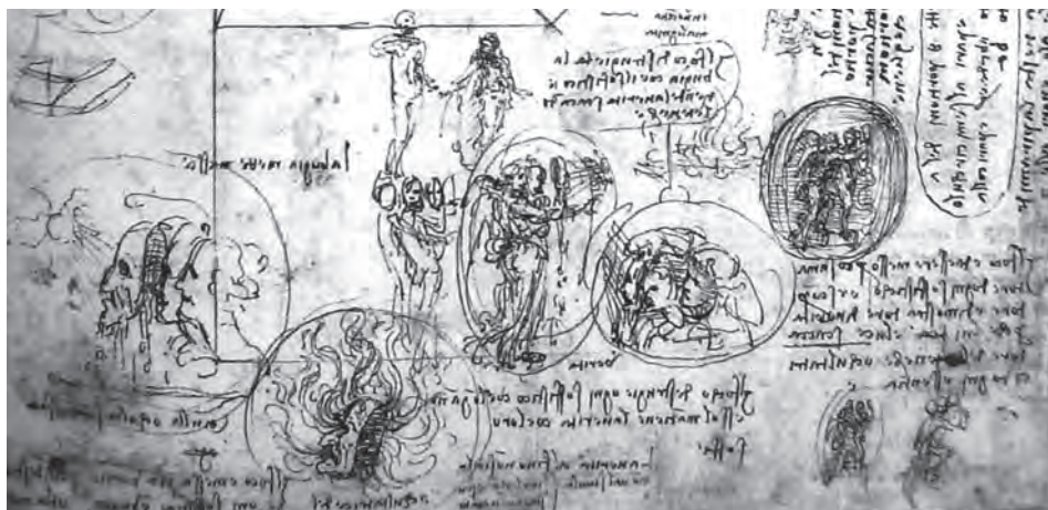
Figura 3. Leonardo da Vinci, Studi per Allegorie della Menzogna e della Verità, Windsor Castle, RL 12700 recto.

nella sua teoria artistica è affermato il principio che l'ombra è considerata indispensabile a «valorizzare» la luce, derivando quindi solo da una corretta cognizione dell'una e dell'altra una veritiera e persuasiva riproducibilità e re-invenzione dell'osservazione naturale nell'opera d'arte: analogamente, il frammento summenzionato esemplifica efficacemente l'essenzialità dell'endiadi verità-bugia, che assurge a binomio fondativo del sostrato antropologico che identifica peculiarmente la mente umana. 64