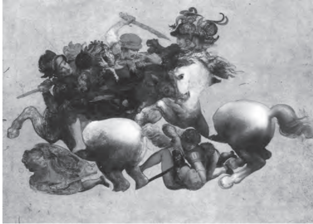
Figura 1. Anonimo del secolo XVI, copia dell'episodio centrale della Battaglia di Anghiari di Leonardo ( Tavola Doria ), attualmente in deposito a Firenze, Galleria degli Uffizi.