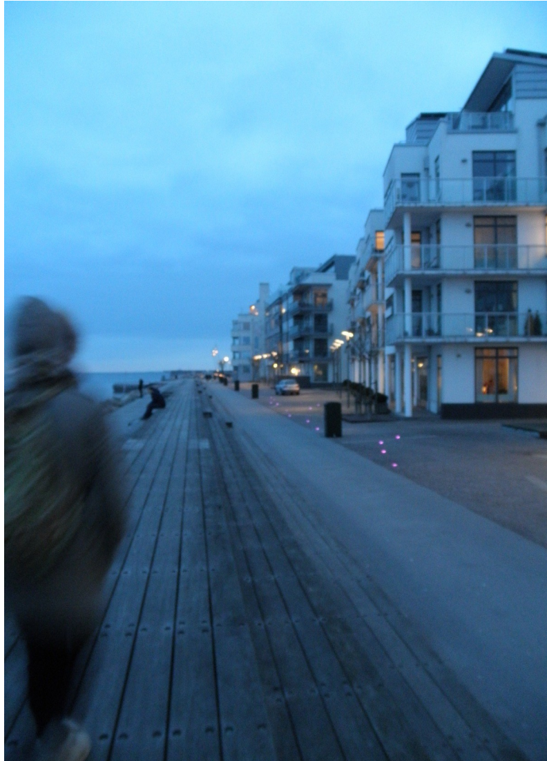
Bo01 à Malmö

Ainsi, les valeurs véhiculées par le paysage sont tout aussi bien d'ordre écologique, relatives à la végétalisation, la propreté, etc. ; esthétique, relatives à ce qui est de l'ordre du beau, mais aussi plus largement de la sensation, de l'expérience sensorielle ; sociale, notamment d'usage, mais aussi relatives à la présence humaine ; et politique, via l'implication des habitants dans la vie et la gestion de leur territoire de vie ou encore le caractère projectuel du paysage.