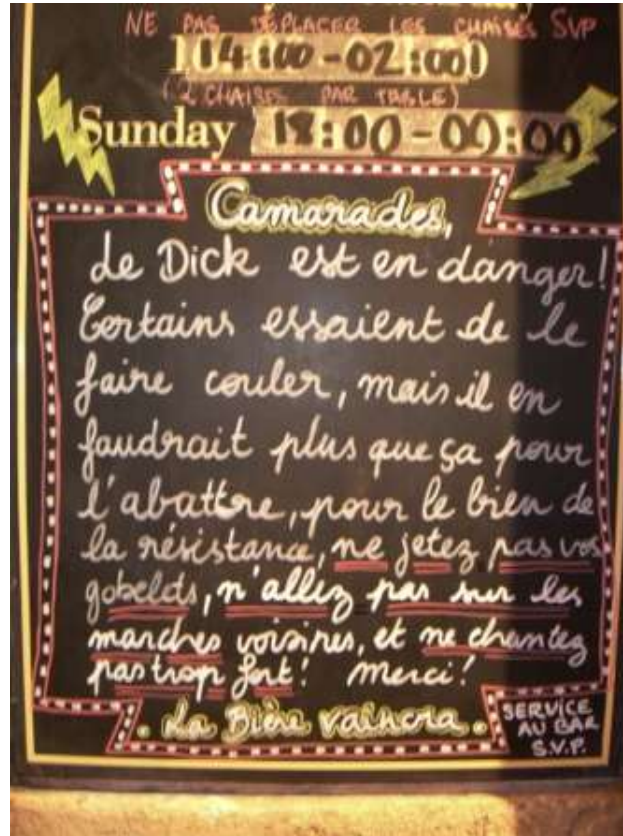
Figure 7 : Avertissement aux clients du pub le Dick Turpin's, rue du Loup (limite du quartier Saint-Pierre), rappelant la « bonne conduite » à tenir (19/09/10)

à ne pas faire de bruit, à ne pas chanter ou crier sous les fenêtres des habitants (fig. 7) sous peine de voir intervenir la police pour tapage nocturne et de risquer une fermeture administrative. Certains établissements ont désormais un ou des agents de sécurité chargés d'y veiller, d'autant plus depuis qu'un arrêté municipal interdit de consommer de l'alcool dans l'espace public dont les terrasses des établissements font partie si les clients ne sont pas attablés pour consommer.