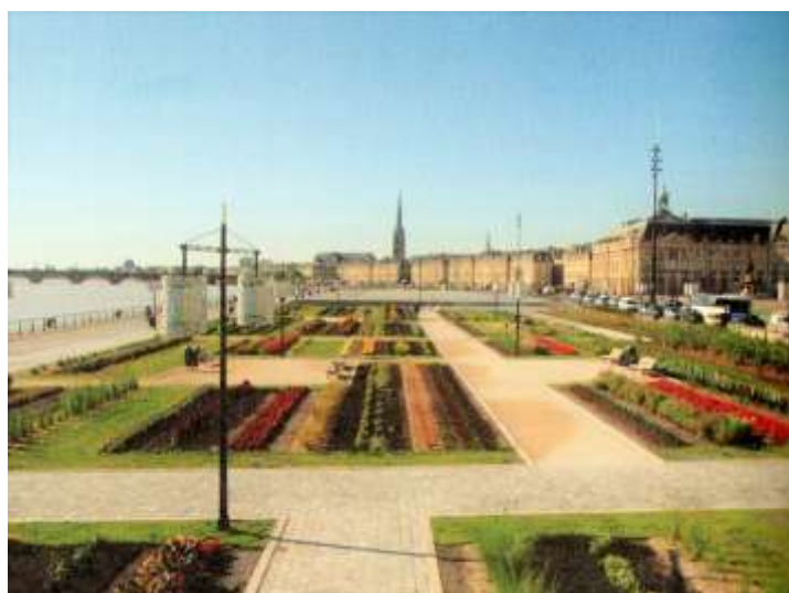
Figure 2 : Les quais après le réaménagement (2007)