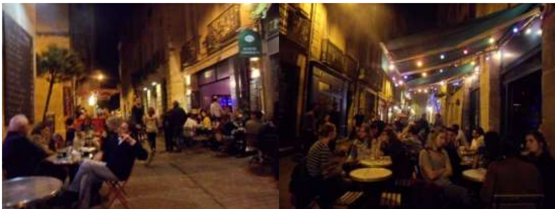
Figure 6 : Une rue du quartier Saint Pierre avec ses terrasses un soir de week-end (ven. 18/10/13, 23h29)

Le plan lumière mis rapidement en place dès le premier mandat d'Alain Juppé (Mallet, 2010) joue un rôle fondamental dans les mutations de la nuit urbaine, en particulier sur les perceptions et le ressenti des usagers (Comelli, 2015). Réalisé par le concepteur-lumière Roger Narboni, il est indissociable du premier projet urbain « Bordeaux les deux rives » dont l'objectif est de redynamiser la ville et son image. Il est doté d'un schéma directeur d'aménagement lumière (SDAL) indiquant les lignes à suivre. C'est ainsi qu'un service des « mises en lumière » est créé au sein du service en charge des projets urbains à la mairie en 1996 dont les premières réalisations sont les éclairages du patrimoine existant tel que le pont de pierre ou encore la place de la Bourse, afin de le valoriser mais aussi d'annoncer les projets à venir (Mallet, 2010).