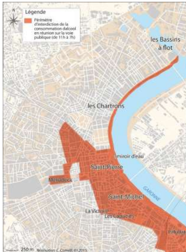
Figure 9: Périmètre d'interdiction de la consommation d'alcool en réunion sur la voie publique de 11h à 7h