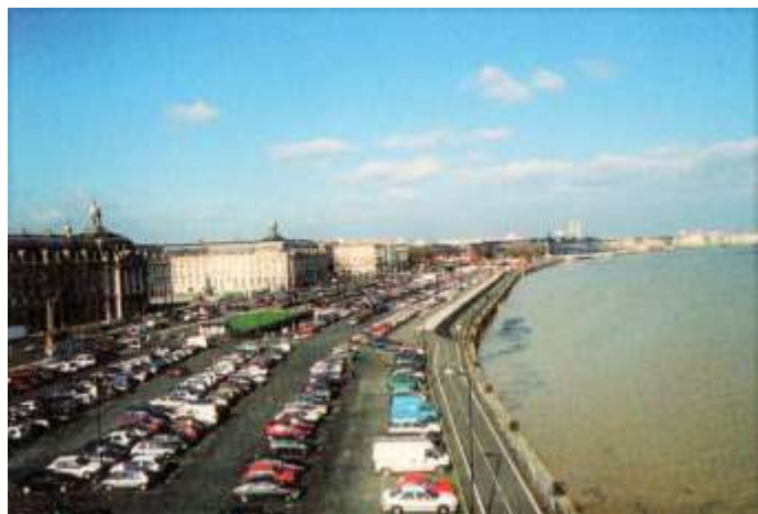
Figure 1: Les quais avant le réaménagement (1999, source : CUB, DR)

urbain de la mandature d'Alain Juppé concerne environ quatre kilomètres de berges et a été achevée en 2009.