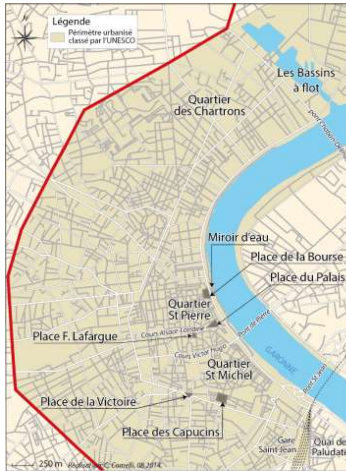
Figure 5: Bordeaux intra-boulevards, localisation des lieux de vie nocturne