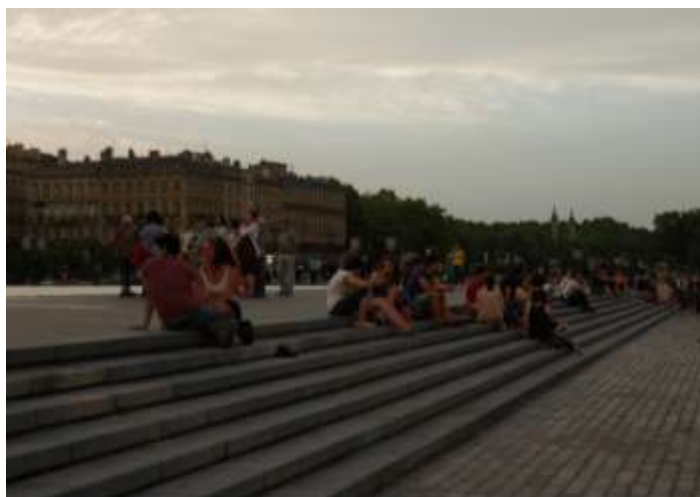
Figure 4: Un vendredi soir au miroir d'eau (06/06/2014, 21 h 30)

Ainsi, la rénovation des quais, à travers les infrastructures présentes, les fonctions attribuées 4 et une mise en lumière soignée a rendu possible des pratiques spatiales et temporelles nouvelles, anticipées ou non, formelles et informelles et plus ou moins bien tolérées. Cette mutation spatio-temporelle n'est pas la seule qui découle des projets urbains menés par la municipalité. Une des principales transformations en termes de morphologie de l'espace, de représentations et de pratiques eut lieu dans le quartier Saint-Pierre qui jouxte la place de la Bourse vers l'intérieur de la ville (voir fig. 5).