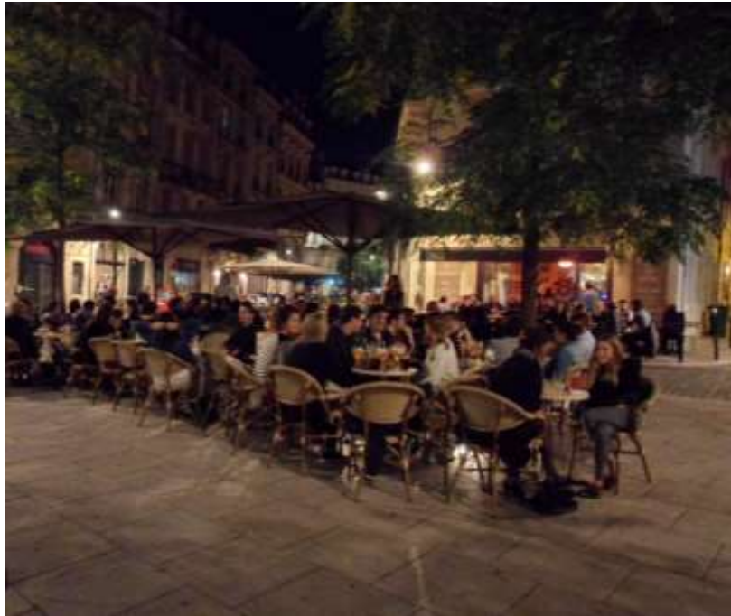
Figure 8 : La terrasse du bar « Chez Fred », place du Palais (19/10/13, 00h15)

Même des secteurs comme la place du Palais, qui ne semblent pas, a priori, poser de problème, sont devenus le théâtre de tensions.