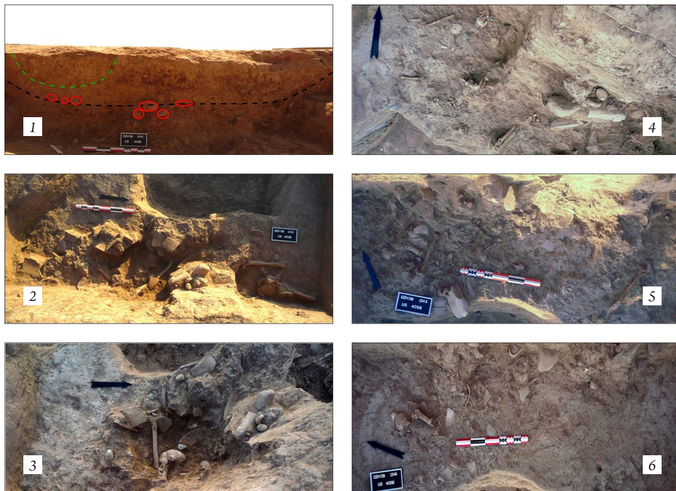
Рис. 3. Впускная могила SU 4058: 3, 1 — стратиграфический разрез с двумя разными слоями отложений; 3, 2–3, 5 — различные ходы раскопок.

It is interesting to note that the upper part of the lower layer containing the bones appears to have been closed off with a row of rather large stones, which delineate an intentional and symbolic closure of the area (Fig. 3. 1). In terms