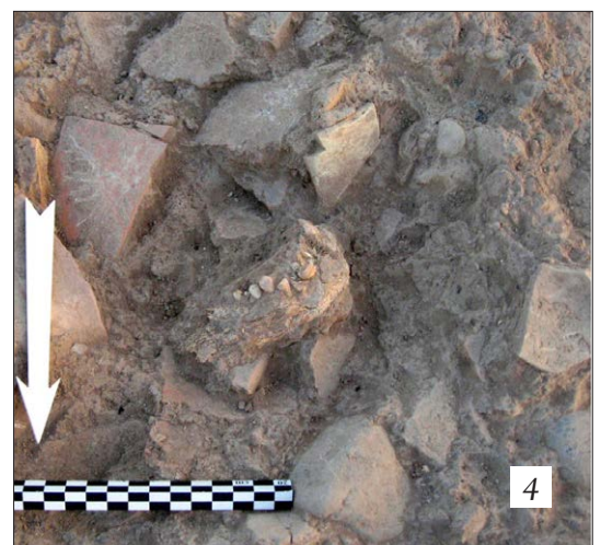
Рис. 4, 1–4, 3 — часть нижней челюсти, позвонок и различные длинные кости из ямы SU 4020; 4, 4 — часть нижней челюсти в яме SU 4264–2.