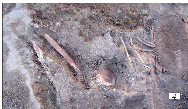
Рис. 1. Основные детские захоронения: 1.1 — могила № 1026; 1.2 — могила № 1027; 1.3 — могила № 1050; 1.4 — могила взрослого человека на поверхности № 1044.