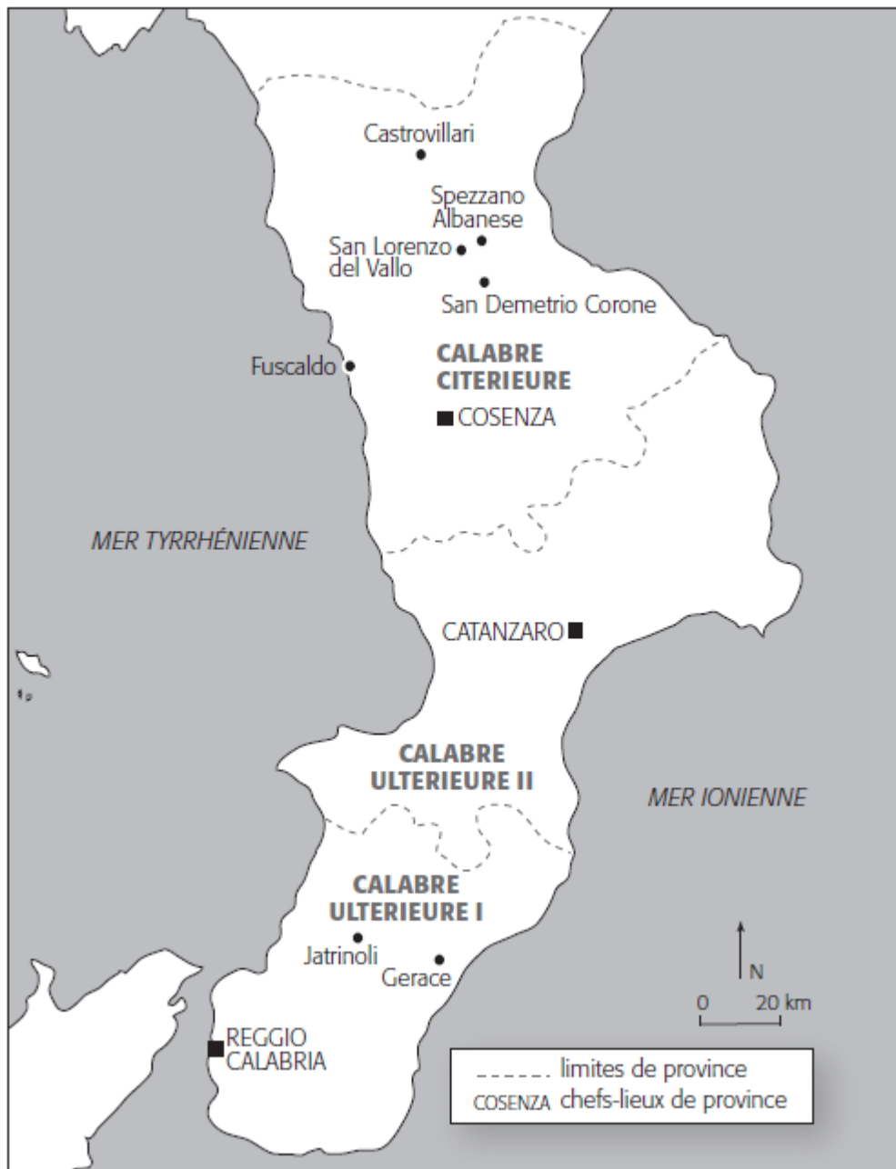
Carte 1. Les provinces de Calabre en 1848

(d'après Biagio Marzolla, Atlante corografico, storico e statistico del Regno delle Due Sicilie eseguito litograficamente, compilato, e dedicato a S.M. il Re Ferdinando , Naples, tip. Militare, 1832).