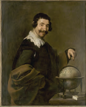
Illustration de la collection tirée du Démocrète de Velazquez, musée des Beaux-Arts de Rouen, © RMN – Gérard Blot.