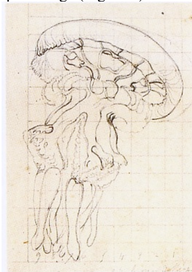
Figure 2 : technique du quadrillage. Croquis préparatoire Rhizostome référence 70/103. Collection Lesueur, Muséum d'Histoire Naturelle de Havre.

Par ailleurs, les peintures sur vélin sont exécutées à partir de croquis tracés dans les conditions difficiles d'un long voyage d'exploration : humidité, mouvements du bateau, etc. Les croquis de Lesueur comportent des indications de couleurs, de taille, ainsi que de certains détails anatomiques (ocelles, des gonades, etc.) essentiels pour l'étude des méduses. À partir de tous ces éléments, le dessin final exécuté sur vélin permet une véritable reconstitution du modèle, grâce à la technique du quadrillage (Figure 2).