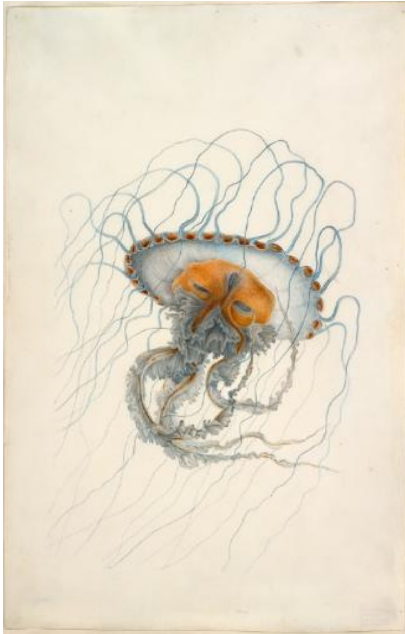
Figure 1 : Chrysaore Lesueur , vue latérale, référence vélin 70/060, vue latérale. Collection Lesueur, Muséum d'Histoire Naturelle de Havre.

Dans la pratique de peinture sur vélin 25 , le support est constitué d'un parchemin et ici plus particulièrement d'une peau de veau mort-né. Sa qualité est optimale lorsque le vélin est blanc, dépourvu d'aspérité, de trous, de taches, d'inégalités d'épaisseur. La tradition de peinture naturaliste sur vélin trouve son origine dans le mécénat de Gaston d'Orléans, vers 1630, et atteint son apogée à la fin du XVIIIème siècle et dans la première moitié du siècle suivant, avec la création d'une chaire d'iconographie au Muséum d'histoire Naturelle (10 juin 1793). Les peintres sur vélin peignent des miniatures, c'est à dire des œuvres réalisées dans un cadre imposé (460mm x 330mm) et grâce à des couleurs détremées à l'eau gommée (l'aquarelle). Le vélin est un parchemin très fragile sensible à la température, à l'hygrométrie, ainsi qu'à la lumière ce qui explique que la réalisation de ces vélin a été faite par Lesueur de