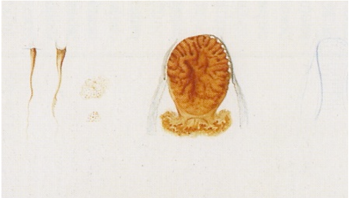
Figure 5 : Détail du vélin de Cétosie bonnet montrant de droite à gauche : le manubrium, des gonades, des canaux et des tentacules (avec la présence des ocelles) référence 70/019. Collection Lesueur, Muséum d'Histoire Naturelle de Havre.

Aucun élément, autre qu'anatomique - représentation du milieu de vie, d'éléments de décor, d'interactions entre organismes -, n'est présent sur le vélin. Enfin, ni échelle ni légende des différents éléments représentés n'apparaissent sur les vélin de méduses. Même le nom de l'échantillon représenté n'est pas toujours indiqué. Les dessins de Lesueur se rapprochent donc davantage d'œuvres d'art que d'illustrations scientifiques, comme celles de Haeckel produites quatre-vingts ans plus tard.