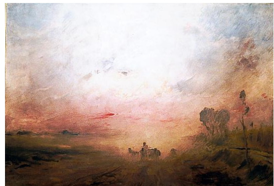
Mihály MUNKÁCSY (1844-1900), Chemin poussiéreux (1883) huile sur toile - coll. Galerie Nationale, Budapest

Si l'on résume donc les « ingrédients » de cette peinture romantique du paysage hongrois, les composants récurrents sont simples. Dans la nature, les ciels, l'eau et l'horizon dénudé sont omniprésents, accompagnés d'un cheminement pour accentuer la profondeur. Un élément isolé – arbre, bergerie, puits – vient suggérer une certaine précarité de l'existence, ou à tout le moins un