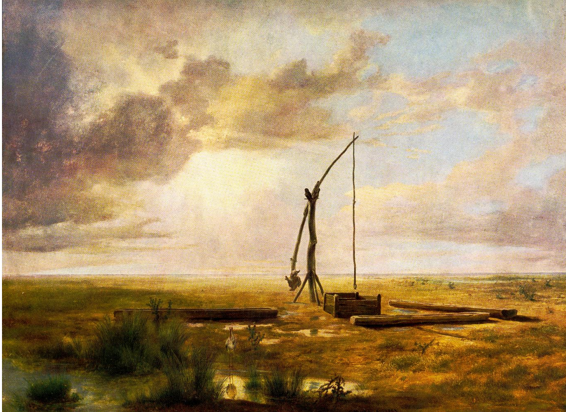
Károly MARKÓ l'aîné (1791-1860) Paysage de la Grande Plaine hongroise avec puits à chadouf (1856); huile sur toile, coll. Galerie Nationale, Budapest

cheminements esquissés dans la steppe, ou puszta , exaltent l'imagination, invitent au départ. De même, le ciel encombré, le marécage au premier plan ou l'aspect désolé de la plaine constituent une source de mélancolie propre à la pensée romantique, laquelle valorise le doute et les tourments intérieurs de ses héros – ici, du spectateur.