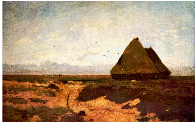
Fig. 4 : László PAÁL (1846-1879), Bergeries (1872) huile sur toile - coll. Galerie Nationale, Budapest