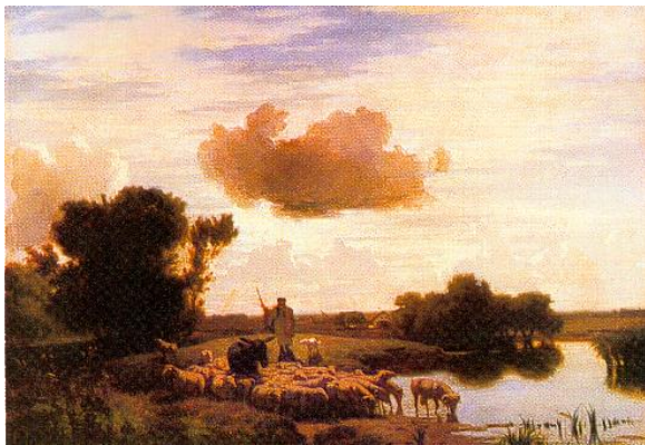
Fig. 3 : Károly LOTZ (1833-1904), Crépuscule (1870) huile sur toile - coll. Galerie Nationale, Budapest

Et même Laszlo Paál (1846-1879), célèbre paysagiste hongrois proche de l'école de Barbizon, a débuté par une peinture plus romantique de l'Alföld, en témoignent ses Bergeries de 1872 : là encore, le tableau illustre des archétypes du paysage hongrois, avec la large part de ciel, les troupeaux à l'horizon et la steppe désolée, dans laquelle seule deux bergeries isolées viennent ponctuer un sentiment de monotonie et de solitude tout à fait dans l'esprit romantique (Figure 4).