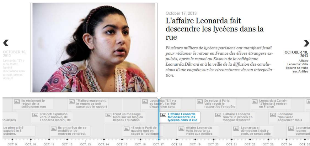
Figure 3 : Interface montrant un événement saillant de la CE sur l'affaire Leonarda