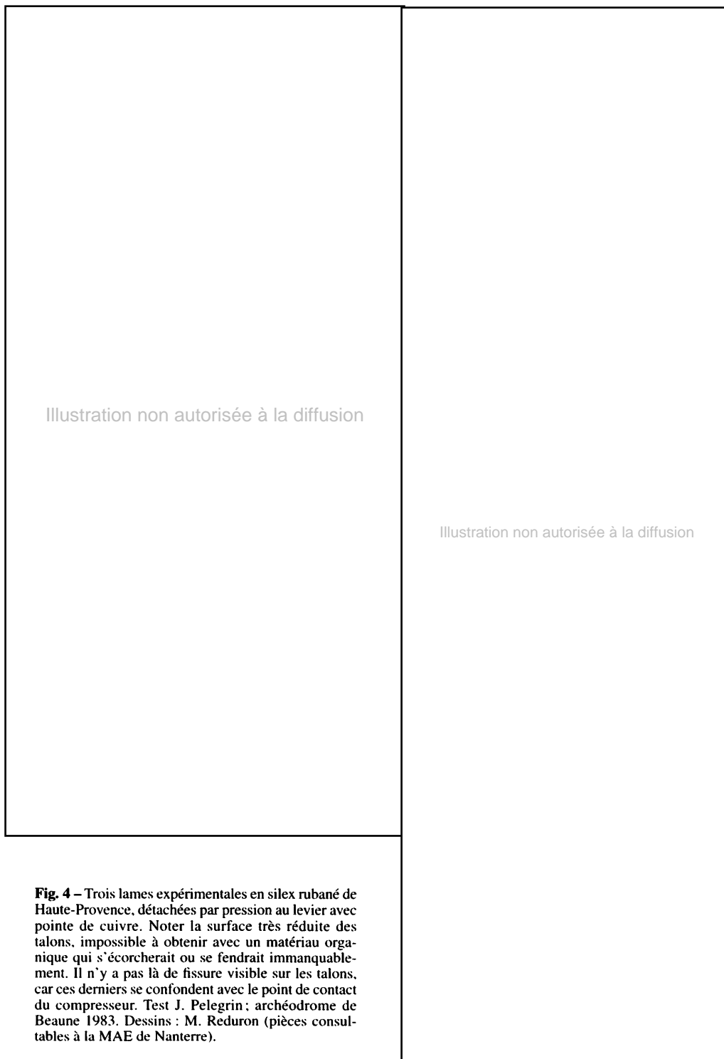
Fig. 4 – Trois lames expérimentales en silex rubané de Haute-Provence, détachées par pression au levier avec pointe de cuivre. Noter la surface très réduite des talons, impossible à obtenir avec un matériau organique qui s'écrocherait ou se fendrait inévitablement. Il n'y a pas là de fissure visible sur les talons, car ces derniers se confondent avec le point de contact du compresseur. Test J. Pelegrin; archéodrome de Beaune 1983. Dessins : M. Reduron (pièces consultables à la MAE de Nanterre).

l'existence d'un moyen pour décupler la force appliquée. En effet, d'après les séries expérimentales réalisées par P. Bodu, J. Pelegrin et P.-J. Texier, les largeurs des lames débitées par percussion directe ou indirecte peuvent atteindre et même dépasser 2,5 cm, alors que celles détachées par pression ont toutes une largeur inférieure à 2 cm (Pelegrin, 1988; Gallet, 1998). Les tests expérimentaux menés par J. Pelegrin ont mis en évidence l'emploi d'un levier pour la production de grandes lames dont la morphologie et les dimensions sont semblables aux lames archéologiques des sites européens ou proche-orientaux (Pelegrin, 1994 et à