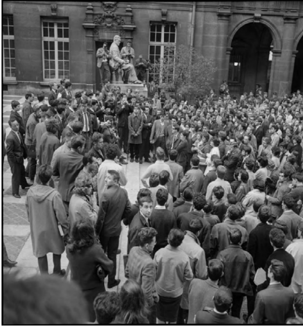
Rassemblement dans la cour de la Sorbonne des étudiants lors d'une manifestation contre l'OAS à la suite du procès de Salan. Paris (75), place de la Sorbonne, 24 mai 1962 (cote 100-18/62 2139 - 1666).

Il faut resituer les pratiques militantes de l'époque dans ce cadre contextuel. La brutalité des répertoires d'action policiers et les mesures d'exception qu'autorise la constitution de 1958 éclairent « la manière dont la violence peut être pensée, légitimée, instituée et, finalement, incorporée et exercée 84 » sans retenue par les forces de police 85 . Le traumatisme de la Shoah chez les militants d'origine juive doit sous ce jour être considéré comme un facteur important – parmi d'autres – qui expliquent le façonnage du rapport à la violence, car ce contexte contribue également à expliquer la diffusion de répertoires d'action politique qui n'excluent pas le recours à la violence parmi les opposants, notamment chez les militants d'extrême gauche. Dans ce cas, d'autres facteurs peuvent également être évoqués, comme l'influence d'un modèle dominant de militantisme inspiré du « révolutionnaire professionnel » de Lénine, valorisant des attributs et qualités socialement codées comme « masculines » et « viriles », comme la combativité (au sens large) et l'aptitude au recours à la violence, mais aussi les conséquences des rapports conflictuels, souvent physiquement violents, qui opposent les militants de la LCR et des organisations trotskystes à ceux du PCF