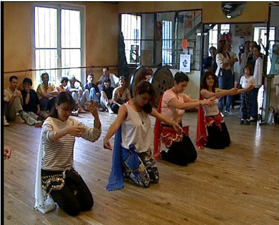
Plan tourné en 1999 dans une salle de danse à Aix-en-Provence. 14