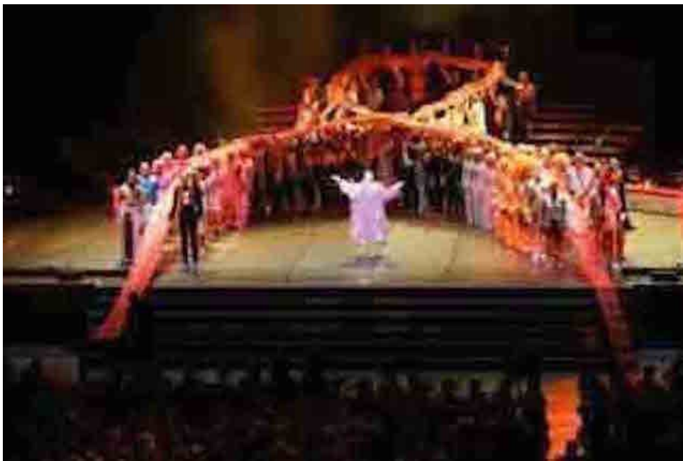
La Maison fait son cirque , Marseille, Le Dôme, 2008. 15