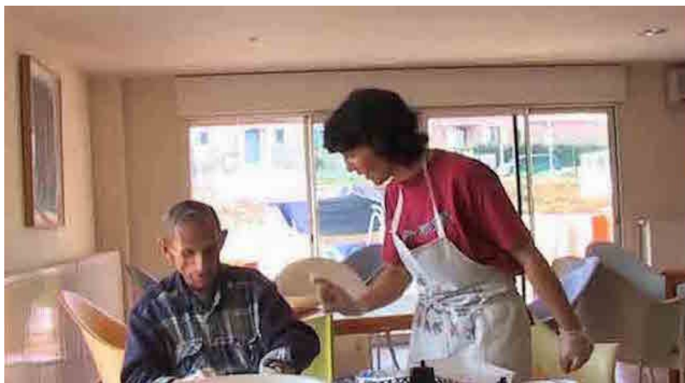
Image extraite du film Une journée avec Georges , P. Cesaro, 2007 18

Des sorties sont même organisées avec certains résidents, étendant l'espace possible de l'observation filmée au-delà des murs de La Maison. Saisir les relations entre soignants et soignés à La Maison réclame donc de sortir des espaces habituellement dédiés aux soins.