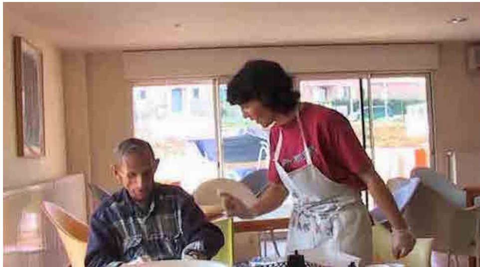
Image extraite du film Une journée avec Georges , P. Cesaro, 2007 18

Des sorties sont même organisées avec certains résidents, étendant l'espace possible de l'observation filmée au-delà des murs de La Maison. Saisir les relations entre soignants et soignés à La Maison réclame donc de sortir des espaces habituellement dédiés aux soins.