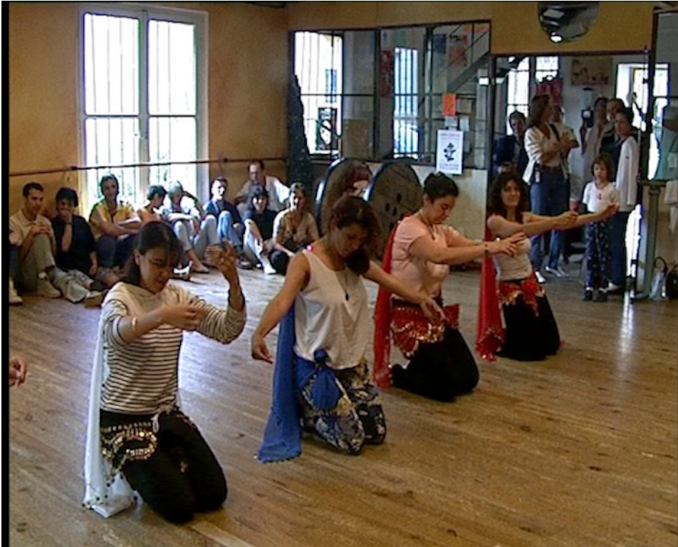
Plan tourné en 1999 dans une salle de danse à Aix-en-Provence. 14