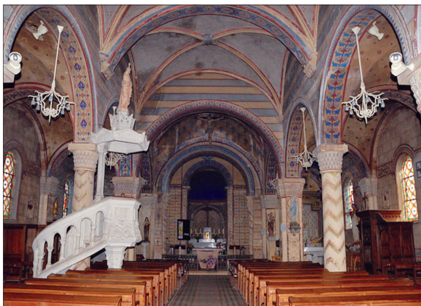
Fig. 2 - Église de Briennon. Nef et parties orientales à l'arrière-plan.

Tachon qui commanda à l'artiste Ormezano la réalisation des peintures qui ornent toujours l'ensemble de l'édifice 6 . Pourtant ces peintures auraient dû disparaître en 1978 lorsque Pierre Lotte, architecte en chef des Monuments Historiques, émit un avis favorable à l'inscription du chevet roman au titre des Monuments Historiques, « si toutefois la commune est disposée, avec l'aide du département et des Beaux-Arts, à faire supprimer les peintures modernes qui dénaturent l'aspect de cette partie de l'édifice » 7 . Aujourd'hui, le chevet roman est en effet inscrit, mais les peintures sont toujours là... L'édifice est donc un hybride associant une nef contemporaine à un chevet ancien, et les documents d'archives et surtout l'observation du bâti révèlent l'histoire d'un site qui avait suscité peu de recherches jusqu'à présent 8 .