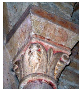
Fig. 9 - Chapiteaux des églises de Briennon et d'Iguérande