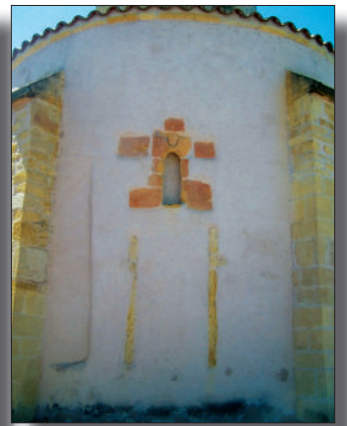
Fig. 7 - Église de Briennon. Abside. La baie nord moderne et le bouchage de la baie romane.

Les arcs latéraux sont percés chacun d'une baie en plein-cintre, lesquelles datent du XIX e siècle, comme le prouvent leur désaxement vers l'ouest au sein de l'arc dans lequel elles s'inscrivent, mais aussi leur montage (l'arc, par exemple, n'est formé que de deux claveaux, alors qu'une baie romane de cette dimension aurait présenté une dizaine de petits claveaux) (fig. 6). Ressemblant beaucoup à celles de la nef, ces baies doivent donc dater elles aussi de 1837. Cependant, il reste deux baies d'origine, visibles de l'extérieur : il s'agit de la baie axiale et de la baie nord, actuellement bouchées (fig. 7 et fig. 8). Elles étaient d'un module beaucoup plus petit que les baies actuelles, mais il est probable qu'elles présentaient un large ébrasement intérieur. Elles prenaient place au centre des arcs de l'arcature interne. La baie romane sud a dû disparaître lors du percement de la baie actuelle.