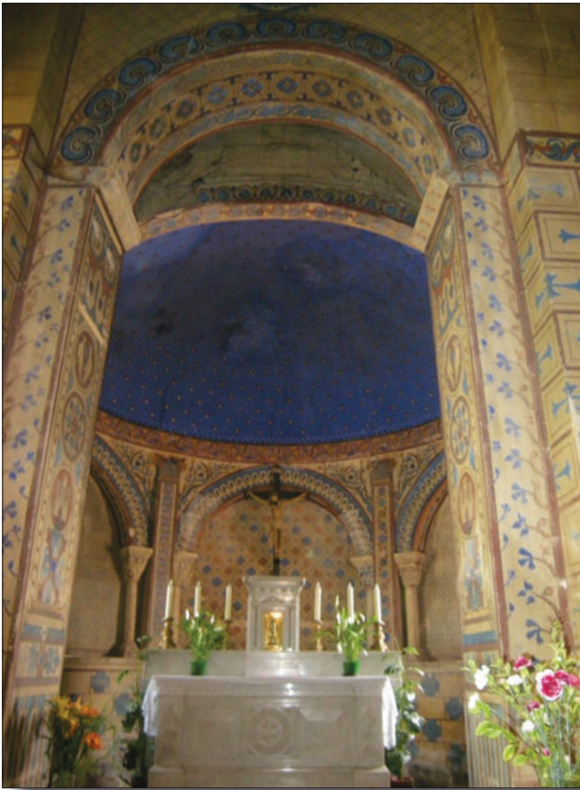
Fig. 5 - Église de Briennon. L'arcade séparant les deux travées du chœur et l'abside.