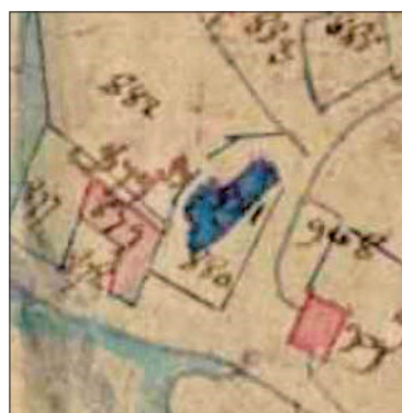
Fig. 3 - L'église sur le cadastre de 1810.

Qu'en était-il de la nef détruite en 1837 ? D'après Édouard Jeannez, il s'agissait d'une nef unique, qui n'était pas romane. Cette nef aurait été détruite sous le prétexte qu'elle était « obscure, trop petite et en très mauvais état » 11 . En 1799 déjà, la nef avait perdu une partie de son plafond, et la toiture était « dans la plus grande vétusté, ainsi que quelques parties de murs » 12 . En 1820, la situation était la même : le plafond de la nef « menace une chute totale » déplorait alors le maire 13 . En 1822, pour pallier le manque d'éclairage, le conseil municipal avait alloué un budget pour le percement d'une ouverture dans le mur sud de l'église 14 . La nef antérieure à celle de 1837 est probablement celle que l'on peut voir sur le cadastre de 1810 (fig. 3).