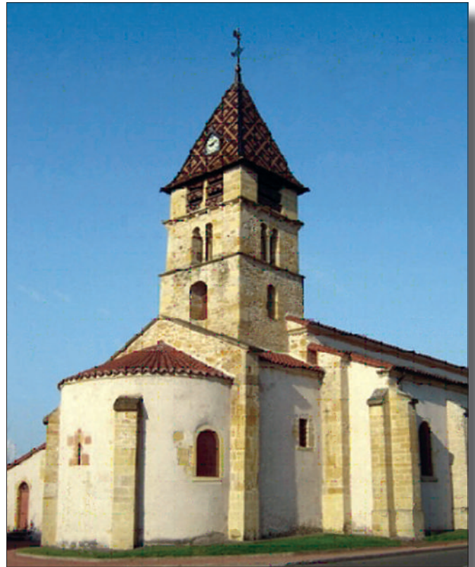
Fig. 1 - Église de Briennon. Chevet.

Quelques décennies après cette donation, vers le milieu du XII e siècle, l'église fut reconstruite, et son chœur roman est conservé (fig. 1). Encore aujourd'hui, l'église est paroissiale et reste le centre du bourg. Pourtant, il s'en est fallu de peu qu'elle perde ce statut en 1817, au profit de l'ancienne abbatale de La Bénisson-Dieu. En effet, depuis le Moyen Âge, l'abbatale appartenait à la paroisse de Briennon, et ce n'est qu'en 1847 que les communes de Briennon et de Noailly furent démembrées pour créer celle de La Bénisson-Dieu 2 . En 1817, le conseil municipal envisageait donc le transfert des fonctions paroissiales sous prétexte que « le hameau de La Bénisson-Dieu, où les affaires les plus conséquentes de la commune se traitent [...], est le plus important de tous ceux qui la composent [la commune] puisqu'il renferme plusieurs maisons bourgeoises, un notaire, des marchands et des artisans ce qui a donné lieu à l'établissement d'une halle et de deux foires annuelles » ; au contraire, le lieu où se trouve l'église paroissiale n'est « composé que de cinq à six petites maisons habitées par des cultivateurs » 3 . Ce projet ne fut finalement jamais réalisé car, dès 1804, un texte rédigé par le curé Coignet laissait penser que les paroissiens y étaient hostiles : le prêtre y soulignait que la municipalité tentait, depuis plusieurs années et par des moyens plus ou moins honnêtes, d'opérer le transfert, mais sans raison, puisque l'état