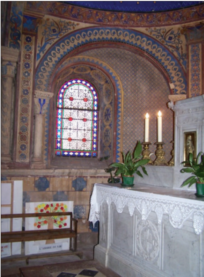
Fig. 6 - Église de Briennon. Abside. La baie nord.