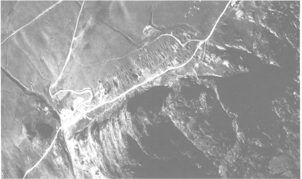
Figure 5. — Brandes-en-Oisans à Huez (Isère) La présence du minerai argentifère a provoqué la création de petites villes abandonnées dès l'arrêt de l'exploitation.