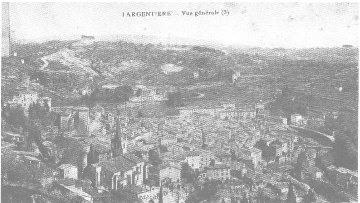
Figure 6. — Largentière (Ardèche) La présence du minerai argentifère a provoqué la création de petites villes dont la survie, jusqu'à nos jours, est liée à la poursuite de l'exploitation (cliché M.-Chr. Bailly-Maître).