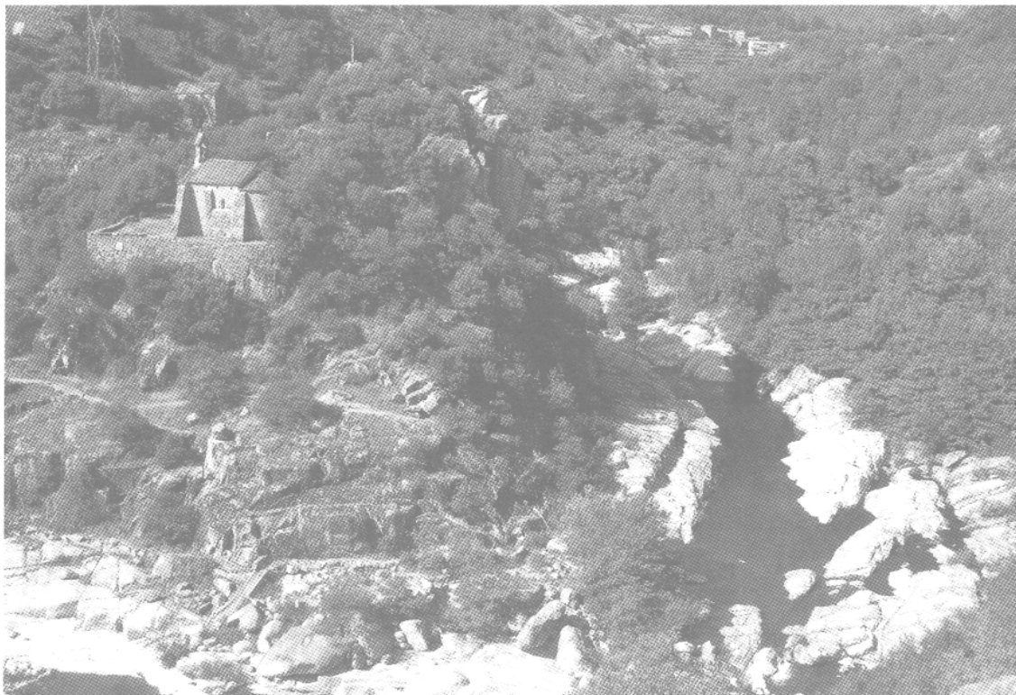
Figure 3. — Château et chapelle castrale de Pied-de-Borne (Lozère) Cet ensemble fait partie du dispositif de surveillance du territoire minier de la vallée du Chassezac.