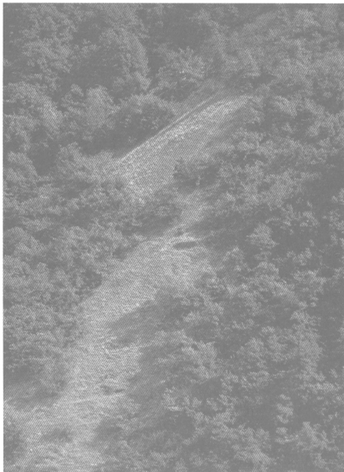
Figure 1. — Site de Petra Alba à Saint-Laurent-le-Minier (Gard) Les haldes formées il y a 800 ans marquent encore le paysage (cliché M.-Chr. Bailly-Maître).