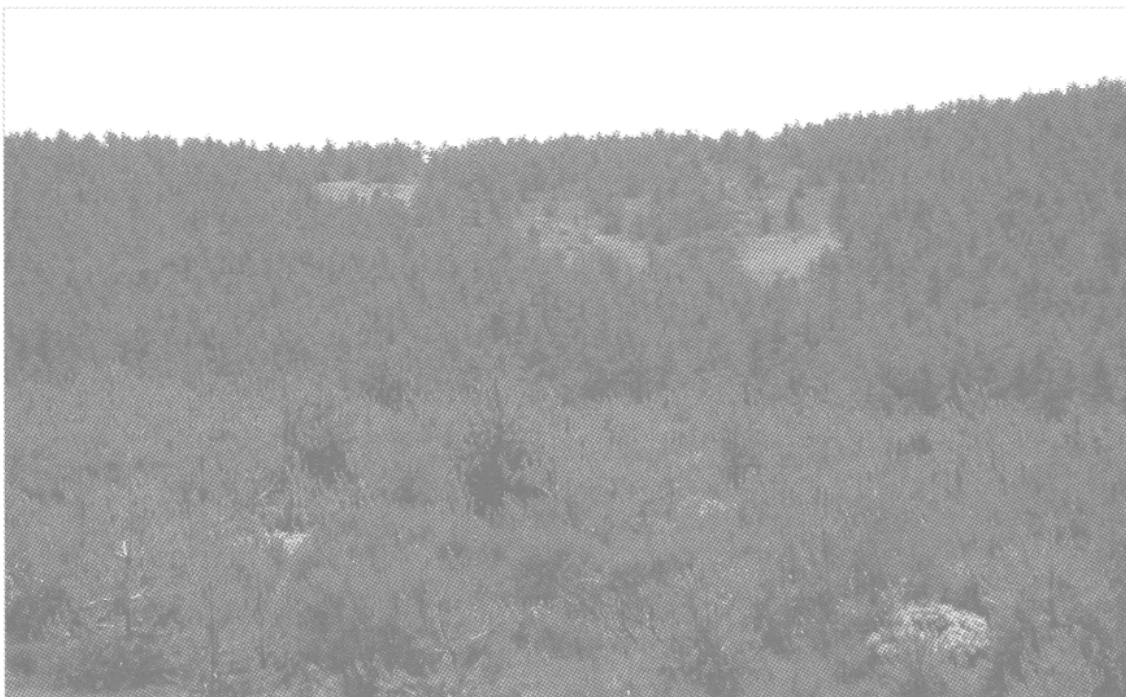
Figure 4. — Mont Lozère (Lozère) La pollution engendrée par la métallurgie du plomb au XI e siècle se lit encore aujourd'hui dans le paysage.