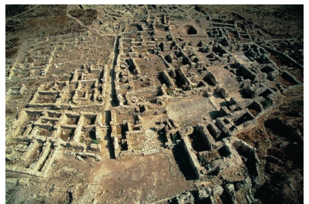
Figure 2. Vue de la zone nord-ouest du tell de Ras Shamra avec le secteur palatial.

Dans d'autres cas, les méthodes d'investigation scientifiques apportent des résultats limités. Des prospections, magnétique et radar, ont été menées récemment à Ras Shamra dans l'objectif de mieux connaître l'urbanisme de la cité. Si, pour d'autres sites syriens de l'âge de Bronze tels Rawda, Sheirat ou encore Khuera, la prospection magnétique a livré le plan presque complet de villes antiques, à Ougarit, les images obtenues furent