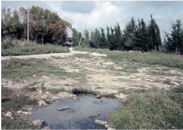
Figure 3. La source de 'Ayn-al-Borj, près d'Ougarit, en 1986 (© Mission de Ras Shamra, cliché Bernard Geyer).

(Fig. 3). Nous savons qu'elles coulaient tout au long de l'année il y a quelque 30 ans, ce qui est encore le cas lors d'années humides. La nappe, facile d'accès aussi bien depuis la cité par des puits de 10-15 m de profondeur que dans les campagnes environnantes, était en mesure de fournir de l'eau, même en fin de période sèche.