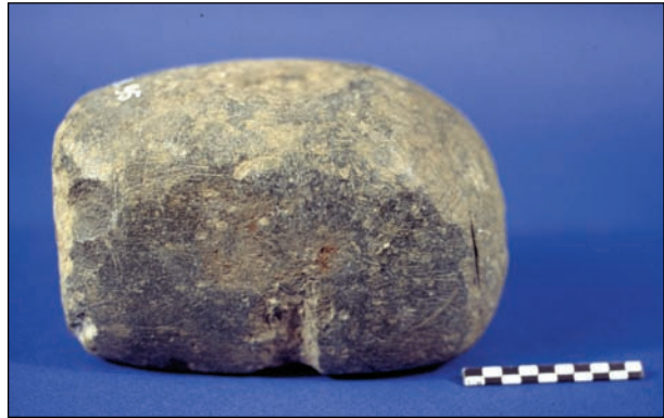
Figure 10. Bloc de chloritite-stéatite (RS 18.95, Damas), Palais royal d’Ougarit.

Plusieurs ruisseaux intermittents, situés au nord de Ras Shamra, peuvent fournir des blocs et des galets de roches sédimentaires : craies, calcaires à débris de fossiles, calcaires durs, nodules de silex, etc. Seul le réseau de la rivière Nahr el-Kandil, à environ 15 km du site, draine la