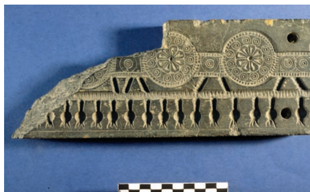
Figure 8. Moule à bijoux en chloritite-stéatite (RS 16.20, Damas), Palais royal d'Ougarit.