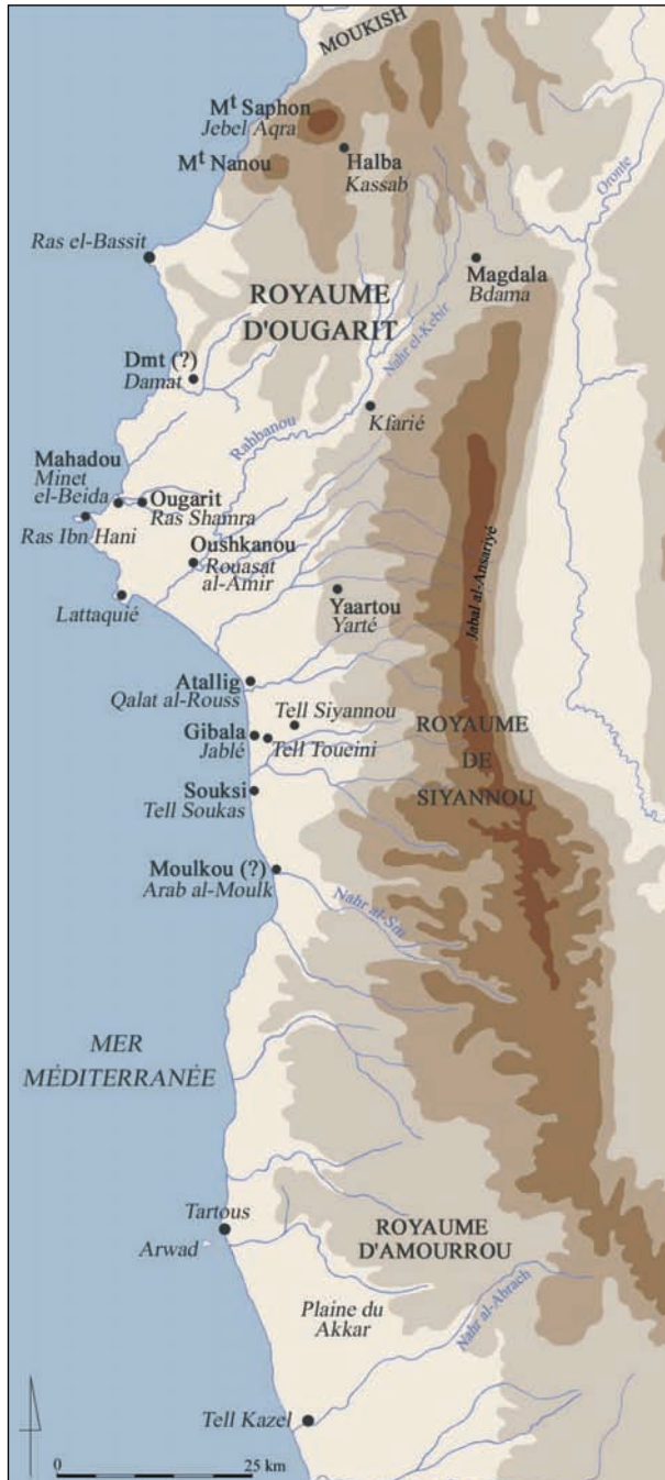
Figure 1. Carte de la région d'Ougarit à l'âge du Bronze récent (Marie-Noëlle Baudrand, d'après document Mission de Ras Shamra).

cours des dernières décennies, ce qui fait d'Ougarit un site de référence pour l'étude de la civilisation urbaine et palatiale de l'âge du Bronze au Proche-Orient. La cité méditerranéenne était alors la capitale d'un riche royaume commerçant, implanté dans un environnement particulièrement favorable, aux marges de l'empire hittite dont il était le vassal, et qui entretenait des relations avec l'Anatolie, la Syrie intérieure, l'Égée, Chypre, le Levant méridional, l'Égypte (Fig. 1).