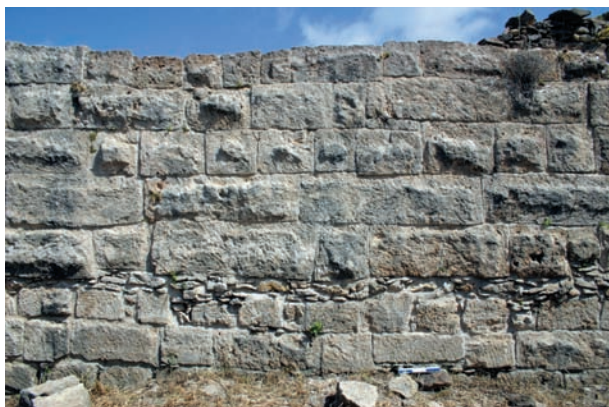
Figure 6. Mur sud du Palais royal d'Ougarit composé de blocs à bossage d'économie et assemblés en alternant l'obliquité de leur profil trapézoïdal.

Les parements étaient aplanis uniquement lorsque cela s'imposait techniquement ou bien, pour présenter une surface très soignée, comme l'intérieur des tombeaux. Partout ailleurs, y compris sur les façades extérieures du Palais royal, seules deux ou trois ciselures étaient taillées en bordure des parements pour faciliter leur mise en œuvre. Le reste de la face était laissé brut d'extraction et formait un bossage, souvent assez irrégulier (voir figure 6). Cette