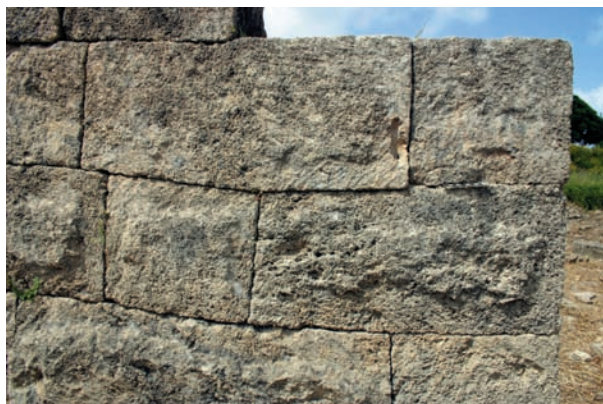
Figure 7. Résidence de Yabninou, d'Ougarit angle nord-est, blocs assemblés à la scie à joint.

Les premières analyses, effectuées sur site à la loupe binoculaire, voire par des tests non destructifs, permettent d'effectuer une détermination provisoire des