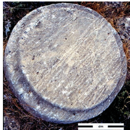
Figure 4. Base de colonne en calcarénite marine indurée placée à l'entrée du Palais royal d'Ougarit.

L'analyse des impacts révèle un tranchant en bronze apparenté à une sorte de hache qui ne pouvait être efficace que sur la calcarénite tendre et ne permettait que de creuser que des tranchées verticales de section trapézoïdale qui, au-delà de 40 cm de profondeur, se refermaient