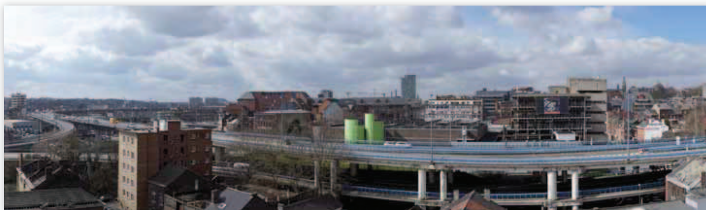
La ville de Charleroi constitue le terrain de cette recherche-pilote sur la vacance immobilière résidentielle

Par Marjorie LELUBRE *, Emilie LEMAIRE ** et Stéphanie CASSILDE ***