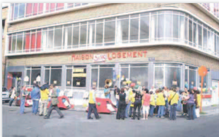
Action contre l'inoccupation des logements à Charleroi (mai 2009)