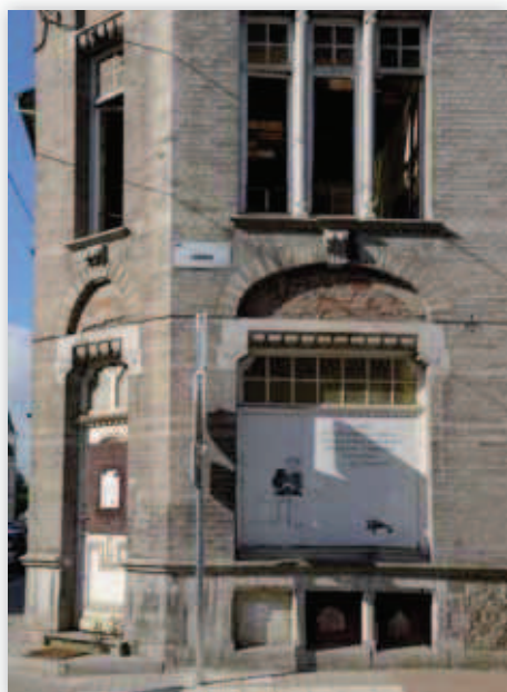
Bâtiment inoccupé à Jambes

Ces réponses nous sont parvenues principalement par le biais de l'enveloppe préaffranchie fournie lors de l'envoi (50,8% des réponses) mais aussi par le biais d'appels téléphoniques (33,7% des réponses) dont le nombre inattendu a réclamé un temps de travail particulièrement important à l'équipe de recherche mais a aussi permis de récolter des informations plus qualitatives sur la situation des propriétaires. Dans certains cas, des entretiens en face-à-face ont également été menés