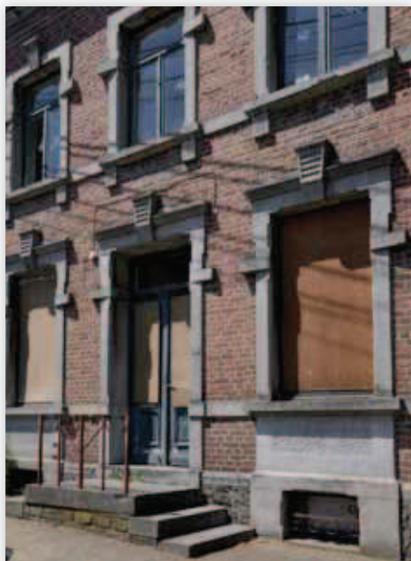
Bâtiment inoccupé à Bastogne