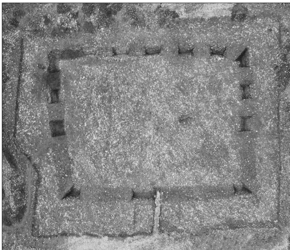
Fig 1 : Enclos Hall final Feuguerolles-Bully

En août 2015, a été réalisée la fouille d'un enclos funéraire au « Chemin des Plates Mares » à Feuguerolles-Bully, commune localisée à environ 6 km au sud-ouest de l'agglomération caennaise. Cette opération a été effectuée dans le cadre du Programme Collectif de Recherche sur les sites fortifiés protohistoriques de Basse-Normandie dirigé par P. Giraud et fait suite à un premier repérage du site par photographies aériennes et à des sondages, effectués en août 2012 dans le contexte de la Prospection thématique sur les sites de hauteur protohistoriques également dirigée par P. Giraud. Ceux-ci ont été réalisés sur l'angle sud du fossé de l'enclos, une faible partie de son aire interne et la partie supérieure de l'angle nord. Les seules structures identifiées, lors de l'opération de 2015, sont le fossé de l'enclos, parallélépipédique de 23 et 24,6 m de long sur 18 m de large, et une fosse circulaire localisée dans son aire interne, mais dont la fonction et la datation n'ont pas pu être déterminées (Fig. 1).