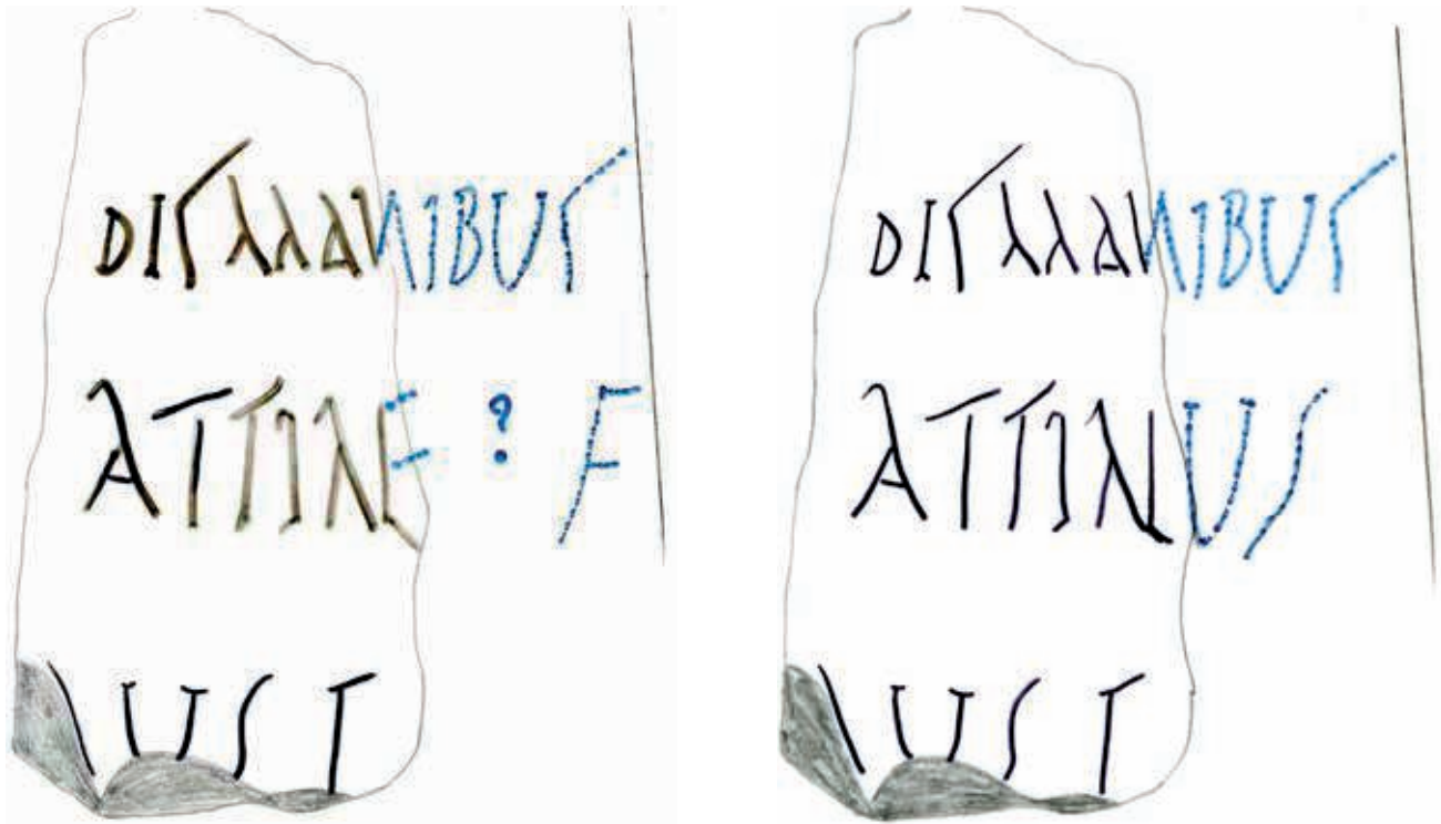
Fig. 5. Les restitutions possibles de la ligne 2.

Plusieurs propositions peuvent être faites :