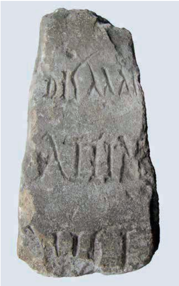
Fig. 2. Le « pyramidion ».

l'une d'entre elles –, il en ignore l'origine. On peut supposer qu'il provient d'une nécropole voisine (cf. fig. 1). C'est à C. Lassus que l'on doit l'identification du bloc, sur lequel il a remarqué les lettres gravées lors de son inventaire des restes du mur du castrum .