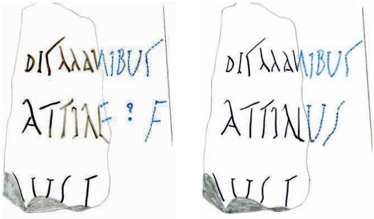
Fig. 5. Les restitutions possibles de la ligne 2.

Plusieurs propositions peuvent être faites :