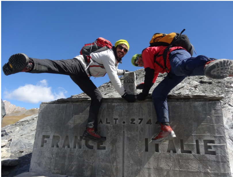
Figure 1 : A la rencontre de la France et de l'Italie au Col Agnel