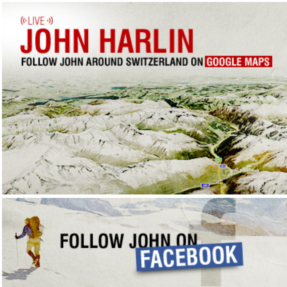
Figure 4. Sur la page principale du site Swissinfo.ch , « High Adventure on Switzerland's Borders », image promouvant la couverture du périple de J. Harlin Face Book