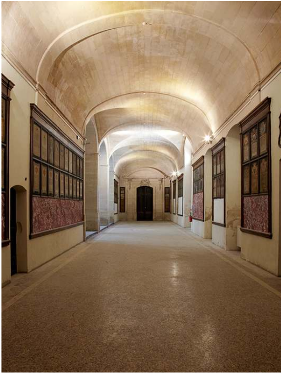
Couloir d'accès entre la chapelle et la grande salle du rez-de-chaussée, décoré de donatifs.