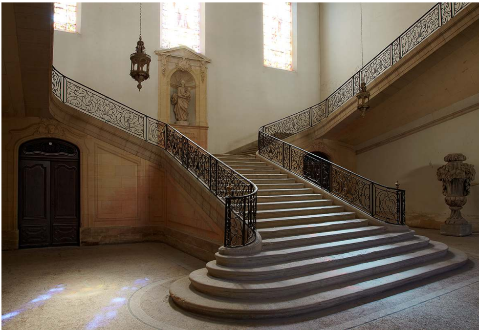
Escalier d'honneur.