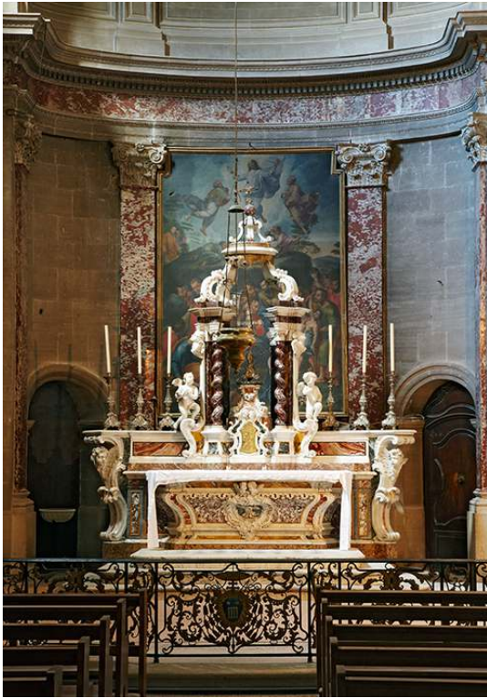
Détail de l'autel et de la balustrade en fer forgé aux armes de Monseigneur Malachie d'Inguibert. Phot. Baussan, Françoise, 2012. © Région PACA. Inventaire général du patrimoine culturel.