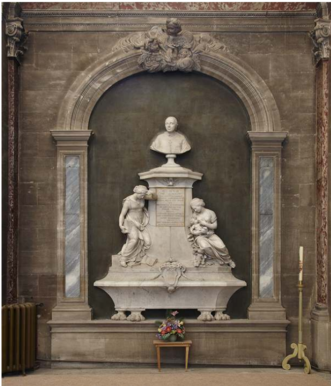
Monument funéraire de monseigneur Malachie d'Inguibert dans la chapelle.