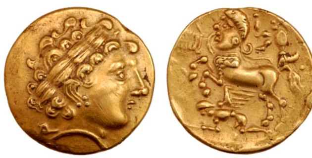
Figure 7 : statère aux types armoricains (BnF 6818 - Paris)