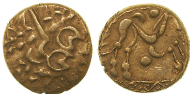
Figure 12 : statère biface (BnF 8596 - Paris)

Manche et les bassins des fleuves occidentaux (Somme, Seine), le monnayage que Simone Scheers nomme au « type belge » [29] s'impose progressivement vers l'est. Cette prospérité sur le plan monétaire révèle et accompagne une culture archéologique bien spécifique : en premier lieu, on y retrouve les sanctuaires les plus anciens qui semblent avoir un rôle économique déterminant, ce qui explique la quasi-absence d' oppida dans la région [30]. Celle-ci a été parfois nommée le « noyau belge » [31], et on considère qu'elle a été occupée par les descendants des premières migrations belges à La Tène C. Ricardo Gonzalez Villaescusa et Thomas Jacquemin présentent le Belgium comme le cœur historique de la Gaule Belgique, considérant la description de cette dernière par les auteurs anciens comme une « tentative d'élargir ce territoire, en étendant le nom d'une de ses parties à toute la nouvelle division administrative, et ce afin de la légitimer » [32].