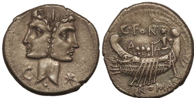
Figure 8 : denier romain de C. Fonteius

Inversement, on constate que des émissions en or produites dans le nord de la Gaule semblent avoir une influence déterminante sur d'autres monnayages en or frappés dans des régions voisines. Citons d'abord le cas des premières émissions de statères attribuées aux Parisii dont le type de revers au « cheval à gorge fourchue » et les dimensions importantes du flan qui trahissent une influence belge (Figure 10). En effet, ces éléments rappellent directement l'important monnayage au « flan large » frappé dans la vallée de la Somme, dont la typologie proprement belge