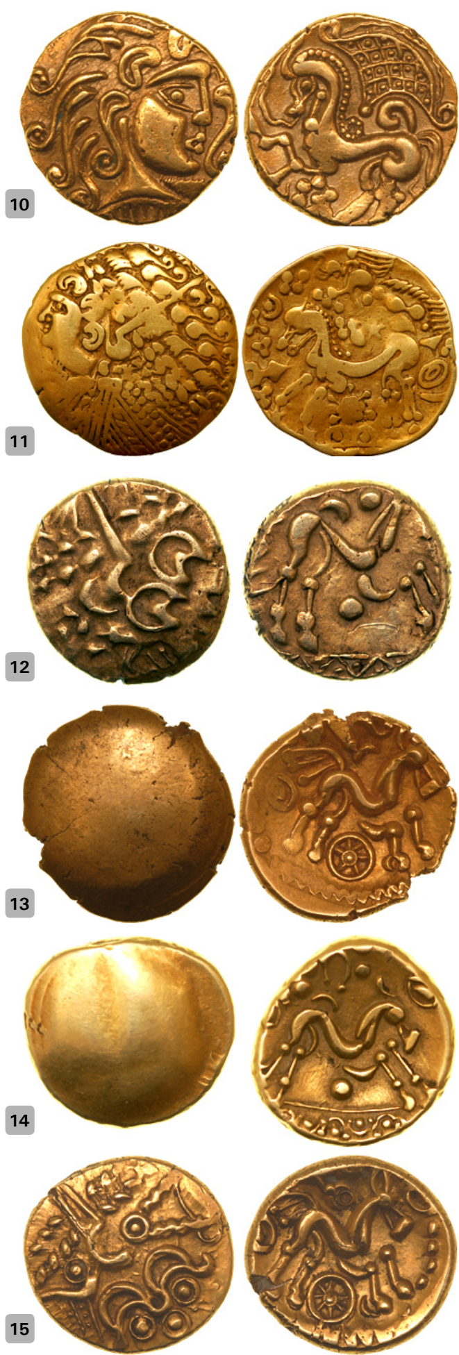
10 : statère des Parisii (BnF 7782 - Paris)

Aux II e – I er s. av. J.-C., le volume très important de monnaies d'or en circulation en Gaule Belgique et à ses marges suggère des utilisations différentes de celles qui prévalaient à la période précédente. La circulation du métal précieux, monnayé ou non, doit aussi induire des circulations propres. Les analyses élémentaires pratiquées sur les monnaies et d'autres objets en or apportent ainsi des informations précieuses. En effet, certains éléments-traces présents dans le minerai aurifère, comme le platine et le palladium, ne sont pas affectés par les différentes transformations du métal : en théorie, il devient alors possible d'attribuer une signature chimique à l'or employé pour la frappe d'un monnayage ou la fabrication d'un objet en or, et donc d'en retracer les