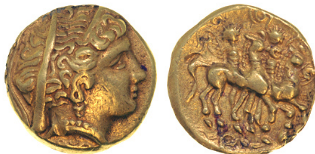
Figure 3 : hémistatère « à la tête d'Héra » (1887 A 274 - Péronne)