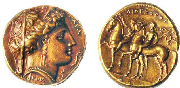
Figure 2 : statère de Tarente (Beistegui 2 - Paris)