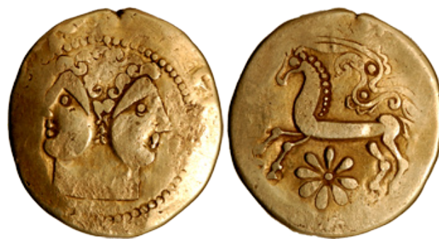
Figure 9 : statère à la tête de Janus (BnF 8933 - Paris)