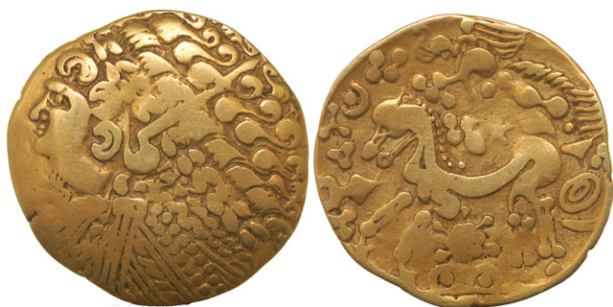
Figure 11 : statère au flan large (BnF 7885 - Paris).