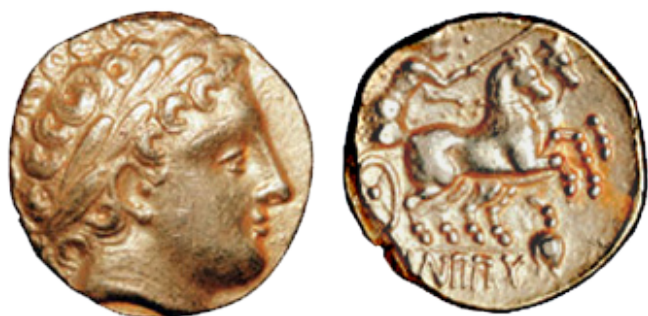
Figure 1 : statère au type de Hesperange (Luxembourg)