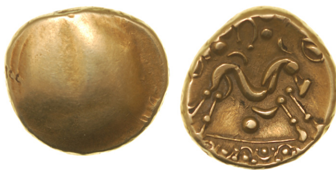
Figure 14 : statère uniface (BnF 8710 - Paris).