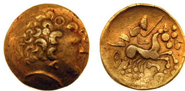
Figure 4 : hémistatère au type de Ciney (BnF 10292 - Paris)