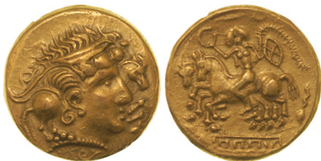
Figure 5 : hémistatère « à la cavalière armée » (BnF 10303A - Paris)