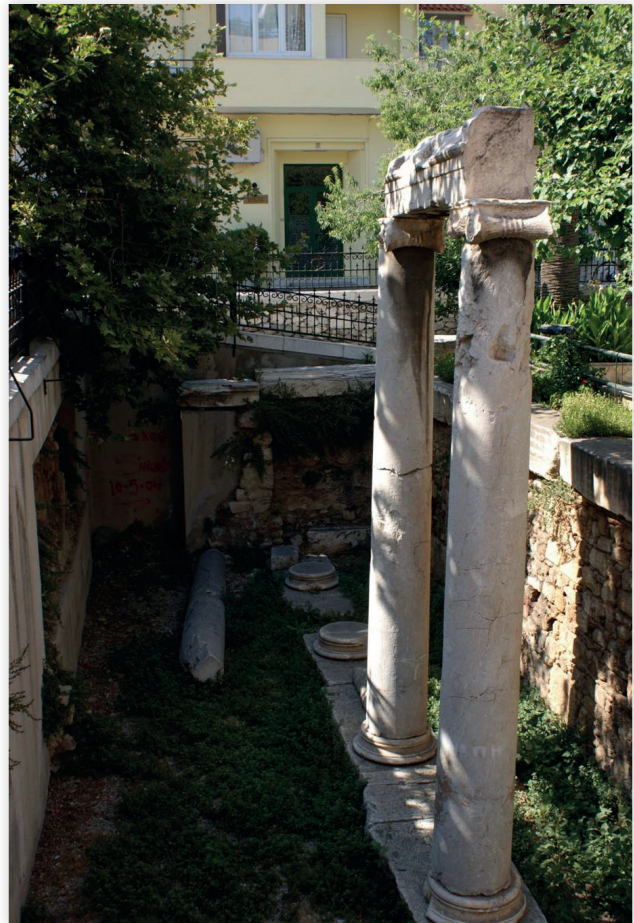
Figure 3 : vestiges antiques visibles place d'Agia Aikaterini.

Peut-on localiser plus précisément le prytanée ? Oui, car Pausanias, en l'évoquant deux fois, nous invite à le rechercher au croisement de deux itinéraires, l'un venant de l' Aglaurion (I, 18, 1-3),