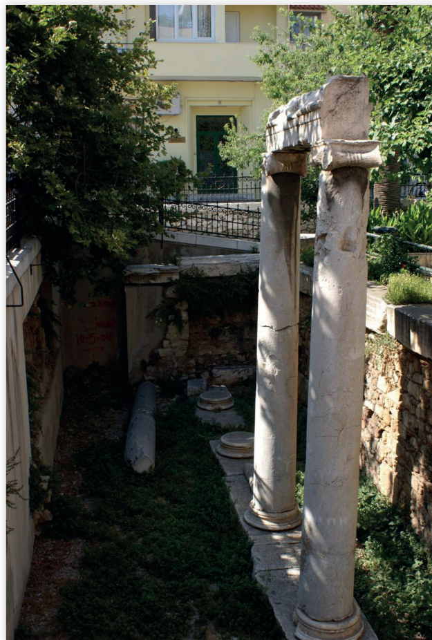
Figure 3 : vestiges antiques visibles place d'Agia Aikaterini.

Peut-on localiser plus précisément le prytanée ? Oui, car Pausanias, en l'évoquant deux fois, nous invite à le rechercher au croisement de deux itinéraires, l'un venant de l' Aglaurion (I, 18, 1-3),