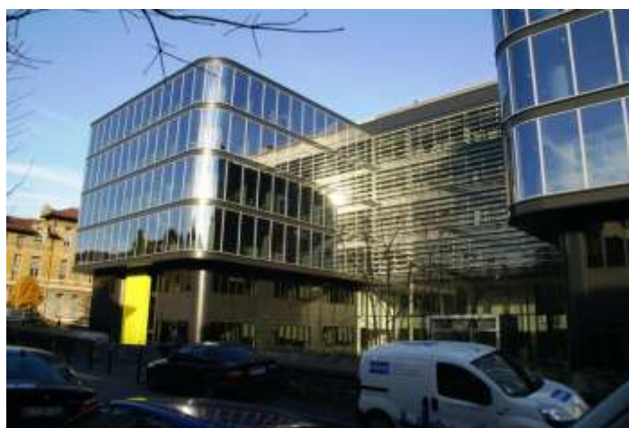
Légende : Plan d'un étage courant et vue extérieure de l'ICM

Chaque plateau peut accueillir une grande ou deux petites entités de chercheurs. La représentation de la proximité comme facteur d'efficacité se traduit ici par l'adossement de la zone de bureaux à celle des paillasses. La densité du nombre de chercheurs dans ces espaces (8 postes pour 40 m 2 ) est appréhendée comme un élément favorisant la communication au sein des équipes. De même, le partage des équipements, la présence de salle de séminaires et le positionnement des circulations en périphérie des plateaux sont imaginés comme pouvant stimuler les échanges.